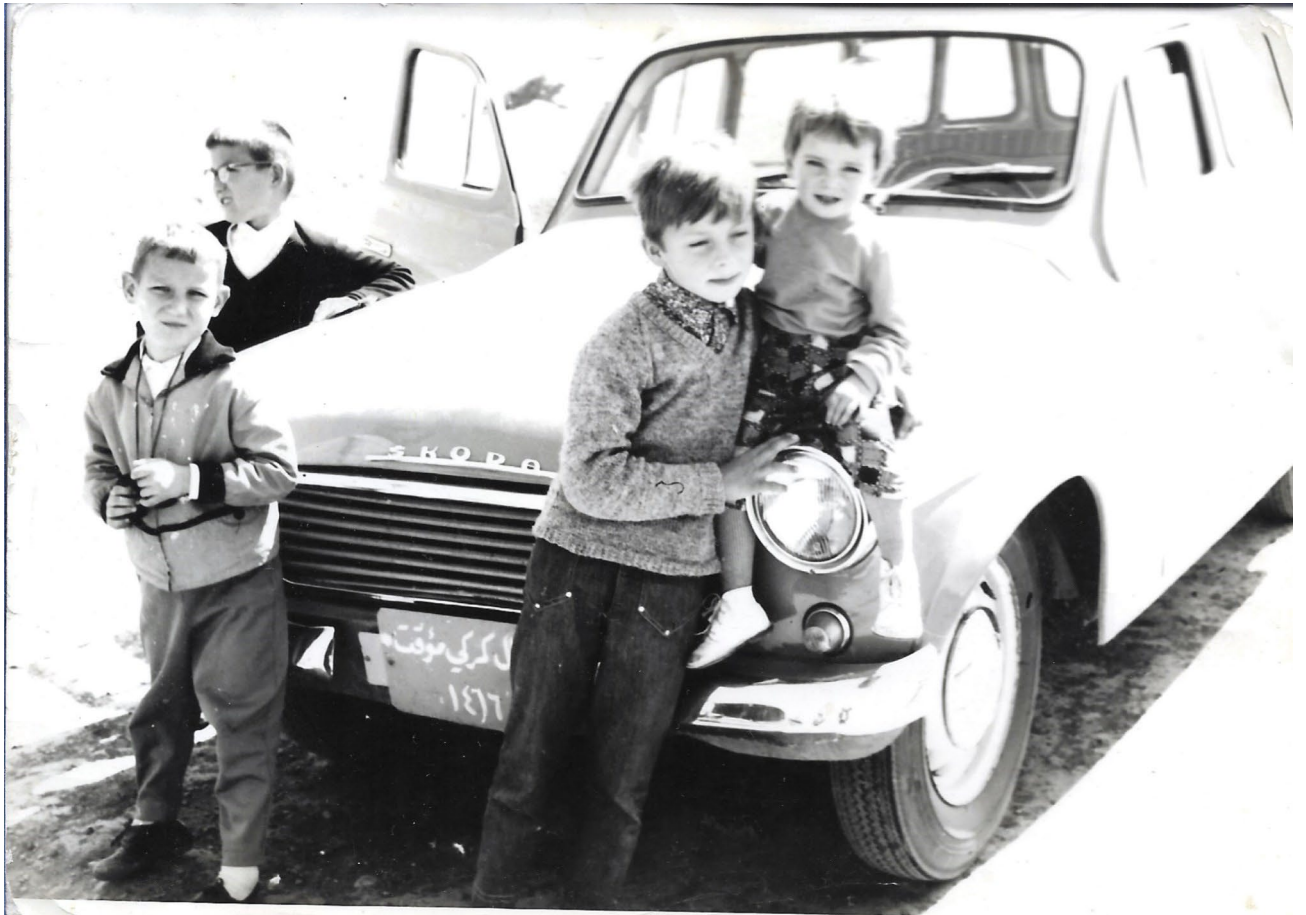
Na výlete pred našou Octaviou (ja s mladším bratom vľavo).

Keď sme po dvoch týždňoch na ceste konečne došli domov a trochu sa spamätali, hneď som sa vrhol na denníček. Prisvojil som si otcov reportážny písací stroj Consul, ktorý mu mama kúpila, že bude svoje vedecké práce písať aj doma, ale nikdy to neskúsil. A na tomto písacom stroji som tie poznámky z cestovného denníku prepisoval. Ale bolo to beznádejné. Veď čo napíšete z takýchto záznamov – vľavo hrad, vpravo benzínová pumpa? Lenže mňa to bavilo a bol som presvedčený, že keď budem tých pár poznámok dokola prepisovať, vždy mi ešte niečo navyše napadne a snáď z toho predsa len niečo stvorím. V našom malom byte ma mal náš otec stále na dohľad a to búšenie do klávesnice mu