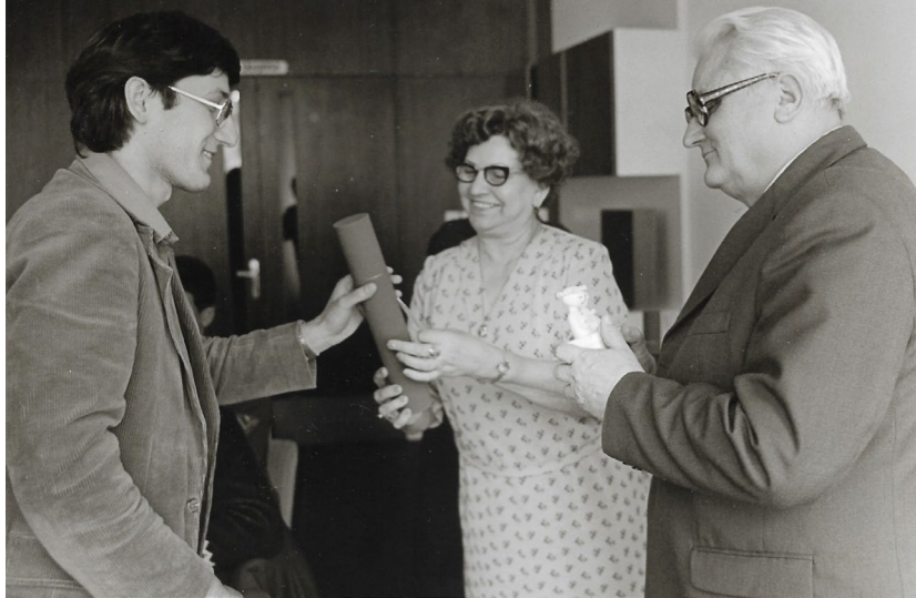
Vítazom súťaže „Novojičínský literární květen“.

Na ďalší rok to bola súťaž „Generace – Ostrava“. V prestížnej súťaži „Jašíkova Turzovka“ som bol na prvý pokus druhý, ale o rok som už aj tu zvíťazil. A tak som, nevdojak, objavil pozoruhodne bohémsky život slovenských spisovateľov.