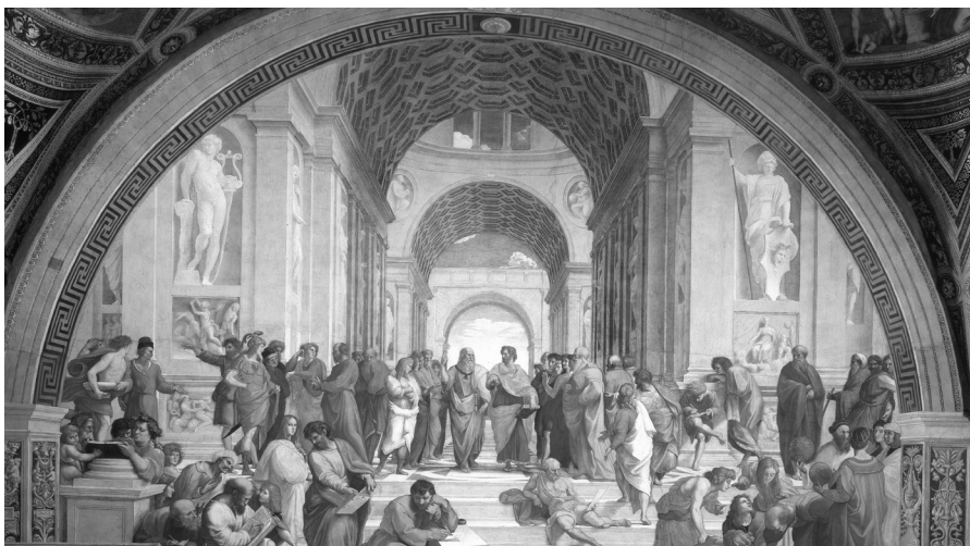
Aténska škola (Rafael) – symbol inteligencie západnej spoločnosti?

Keď sa pozriete na mapu Európy, zistíte, že väčšina štátov na našom kontinente má hranice položené na nejakej prírodnej jednotke (pohoria, rieky). Tieto prírodné prekážky boli síce nepriaznivé pre centralizáciu, ktorá znamenala výrazný počiatkový náskok Číny, ale neboli veľkou bariérou pri šírení a výmene informácií. Ľudia jednotlivých krajín sa mohli rozhodovať rozdielne. Príkladom môžu byť zámorské plavby. Tieto drahé investície zakázali čínske elity niekedy v priebehu 15. storočia, zatiaľ čo Krištof Kolumbus, odmietnutý v Portugalsku, išiel skúsiť šťastie do Španielska. Decentralizácia, ktorú v Európe umožnilo prírodné prostredie, dala ľuďom možnosť aplikovať a skúšať viaceré možnosti a cesty.