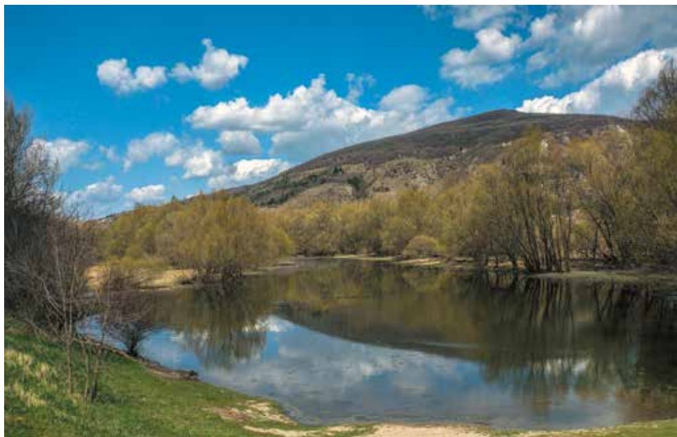
Devínska Kobyla z Devína

území Bratislavy niet vyššieho vrchu ako je Devínska Kobyla a mierne ho prevyšujú až zalesnené vrchy ležiace za severnou hranicou katastrálneho územia v okolí Bieleho kríža. Horský masív na južnom ukončení Malých Karpát vyniká svojou mohutnosťou a pôsobí dominantne, pretože z dvoch