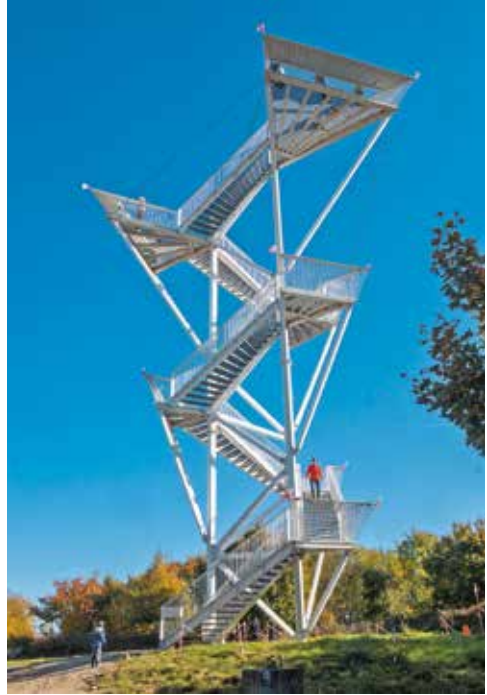
Rozhľadňa na vrchole Devínskej Kobyly

Devínska Kobyla je najvyšším vrchom Devínskych Karpát, ktoré sú najjužnejším podcelkom pohoria Malé Karpaty. Vrchol vystupuje do nadmorskej výšky 514 metrov, čo je najvyšší bod katastrálneho územia Bratislavy. Od centra hlavného mesta Slovenska leží asi 9 kilometrov západným smerom. Masív Devínskej Kobyly je na západnej strane ohraničený riekou Moravou a z južnej strany korytom Dunaja. Obe rieky sú v danom úseku pohraničné a Slovensko sa o ne delí s Rakúskom. Na severe masív strmo klesá do Borskej nížiny, na východnej strane je klesanie do plošiny Bratislavského predhoria pozvoľnejšie.