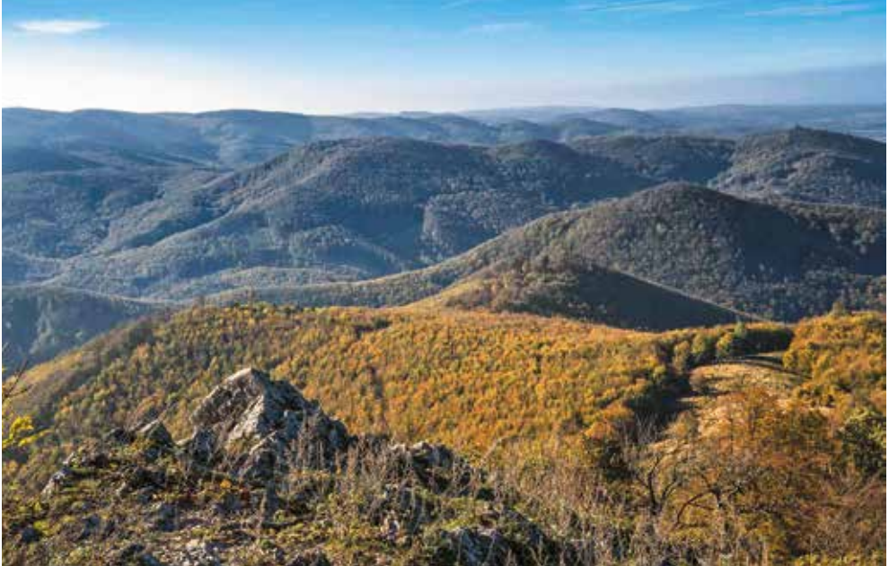
Pohľad z Vysokej na juh

zachovaných železničných podvalov a do skaly vysekaný priesek. Šlo o lesnú železničnú trať vedúcu z malokarpatských lesov cez Rohožník až na parnú pílu v Malackách. O vybudovanie trate legendárnej „štrečky“ sa v roku 1892 zaslúžili Pálffyovci. V tom čase ešte nejstvovala železničná trať zo Zohora do Plaveckého Mikuláša, tú otvorili až v roku 1911. Po železnici sa vozieval okrem dreva aj lomový kameň a tehly. Podľa malackých pamätníkov sa na vláčiku často zviezli aj výletníci. Úsek trate na trase výstupu pri Vývrati postavili neskôr, asi až v roku 1933. Bola predĺžením od horárne Baďura nad Rohožníkom cez Vývrat až na Hubalovú, ležiacu hlboko vnútri Malých Karpát. Železničku zrušili v roku 1938.