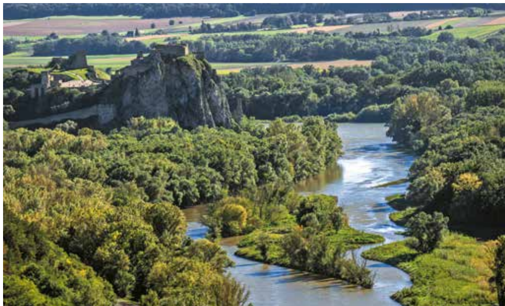
Devín zo Sandbergu

Desiatky rokov bol vrchol Devínskej Kobyly verejnosti neprístupný. Obsadili ho vojaci Československej ľudovej armády obsluhujúci raketovú základňu. Po Nežnej revolúcii nevyužívané vojenské objekty pustli a postupne sa z nich stali ohyzdné ruiny. Po viacerých neúspešných zámeroch revitalizácie sa v roku 2020 na vrchole Devínskej Kobyly objavila rozhľadňa, ktorá si pre svoj tvar vyslúžila prezývku Modlivka. Turisti tak získali jedno z najlepších vyhladkových miest v okolí Bratislavy. Vďaka výške 21 metrov sa z najvyššej plošiny môžeme ponad les rozhladať do pozoruhodných diaľav. Dokonalý kruhový výhľad siaha až za slovenské hranice, okrem blízkeho Rakúska dovidieť aj do Maďarska a dokonca aj na južnú Moravu. O kvalite výhľadu svedčí skutočnosť, že za ideálnych podmienok sa podarilo dohliadať až na Pohronský Inovec a Štiavnické vrchy.