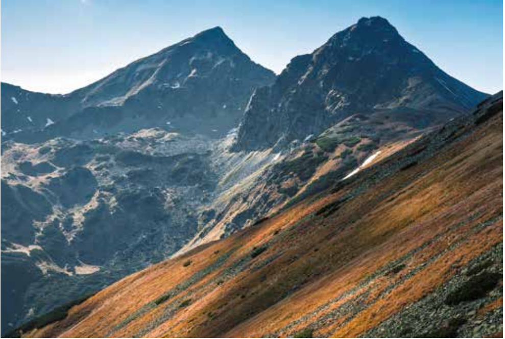
Plačlivé a Ostrý Roháč

vrchy s najväčšou publicitou. Väčšina ľudí do svojho zoznamu na popredné miesta umiestni aj tzv. ikonické vrchy, akými sú na Slovensku napr. Kriváň, Kráľova hoľa či Babia hora. Bezpochyby nie malú rolu zohrá aj lokálpatriotizmus, t. z. bližší vzťah k vrchom blízko domova alebo v rodnom kraji. Okrem toho je tu ešte veľmi subjektívny prvok, a to osobná skúsenosť, zážitok, dojem z vlastného poznávania prostredníctvom rôznych foriem turistiky. Vo výhode sú scestovanejší ľudia, ktorí prešli a na vlastné oči spoznali veľký kus Slovenska. Na jednej strane majú širší zoznam adeptov na krásu, no na druhej strane im to zároveň sťažuje výber medzi nimi.