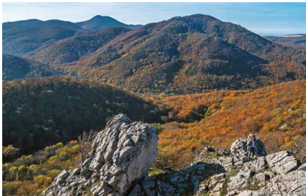
Vysoká z Malej Vápennej

V panoráme Malých Karpát sa pri pohľade od Záhoria vymyká jeden vrch odlišujúci sa od ostatných svojím osobitým tvarom. Siluety kopcov tiahleho pohoria vyzerajú ako rozložené klenby so širokými chrbtami a len jeden má tvar štíhleho kužela nápadne vytrčajúceho nad svojich horských susedov. Keďže sa z diaľky javí ako najvyšší, dostal meno Vysoká.