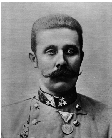
Následník trónu František Ferdinand

syn nosí slovenský kroj a dobre mu pristane. “ Takto sa následník trónu nevyjadroval iba pred Slovákami. V liste Maximiliánovi Vladimírovi Beckovi z 28. 8. 1900 František Ferdinand napísal: „ Už bolo dosť ľútostivej politiky. Všetkému sú v každom smere a vždy vinní Maďari a tak ako ten Riman, ktorý vždy hovoril ceterum censeo Cartago esse delendam, tak ja hovorím ceterum censeo Mađaria (Magyarien) esse delendam. “ Inde sa vyjadril: „ Nech idú Maďari do čerta s ich privilégiami! Sú taký istý národ ako ostatné. Prečo chcú mať viac práv ako Česi, Poliaci, Rumuni a Slovinci? “