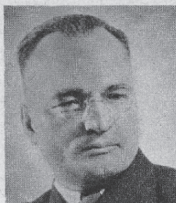
Dr. Jozef Lettrich predseda SNR

Zástupcovia DS v SNR a v Zbore povereníkov