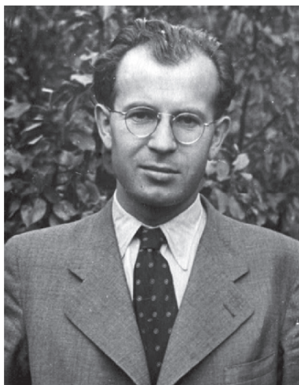
Gustáv Husák, predseda Zboru povereníkov 1946 – 1948

politického separatizmu? Je to základný pomer Slovenskej národnej rady k ústrednej vláde. Slovenská národná rada neberie na vedomie, že je tu ústredná vláda, kam ona vyslala svojich zástupcov.“ Posledné slovo mal predseda KSČ Klement Gottwald, ktorý sformuloval zásady jednomyseľne prijatého uznesenia z porady: „ Politika našej strany na Slovensku sa má v budúcnosti vykonávať nie odlúčene, ale naopak, má sa orientovať na progresívne sily v českých krajinách a na progresívne sily, ktoré sú zastúpené vo vláde. “