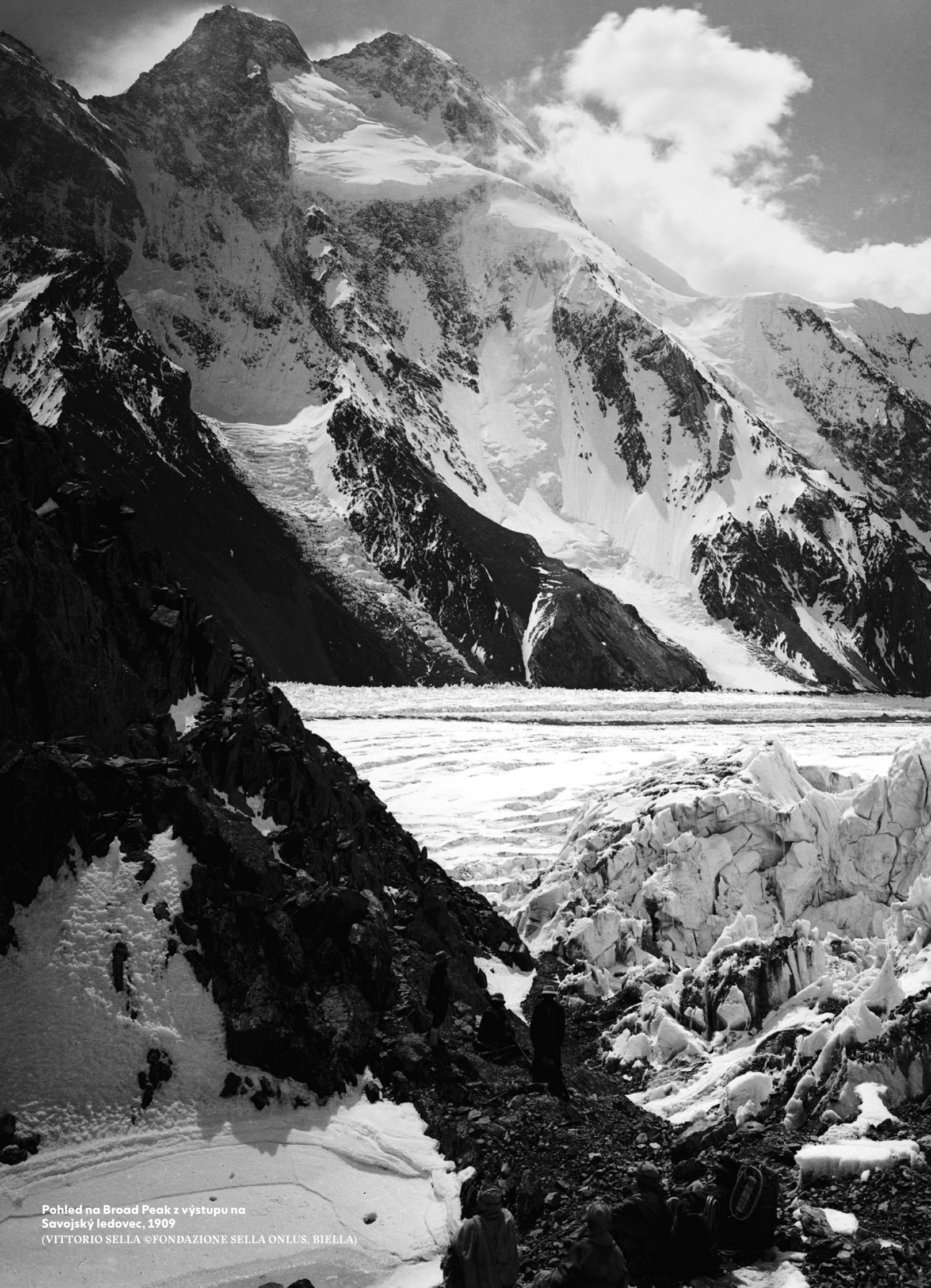
Pohled na Broad Peak z výstupu na Savojský ledovec, 1909