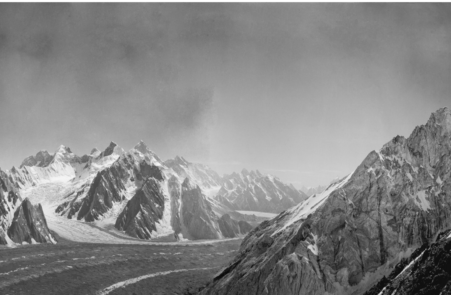
Panoramatická fotografie, kterou pořídil Vittorio Sella během expedice vévody abruzskeho v roce 1909. Sbíhají se na ní ledovce Baltoro a Godwin-Austen. Zleva doprava: K2 a hned vedle Skjang Kangrí, Broad Peak a masiv Gašerbrum s jasně viditelnou, třpytící se stěnou Gašerbrum IV, Baltoro Kangrí, Čogolisa, Mitre Peak (v popředí, nad souběhem ledovců) a masiv Mašerbrum (v pozadí).

Když Marco Polo roku 1271 dospěl na konec své cesty z Benátek do Číny, neuvědomil si, že právě minul největší horskou soustavu světa: Himálaj, více než 2200 kilometrů horských reliéfů tyčících se nad údolímí řek Brahmaputra a Indus a rozkládajících se na ploše v šíři od 250 do 350 kilometrů.