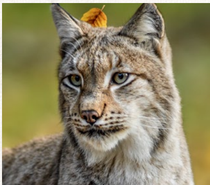
rys ostrovid – strana 94