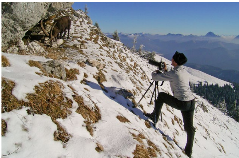
Kozorožec a jeho pozorovatel: v oblastech, kde zvířata nejsou lovena, může být jejich pozorování docela snadné

Na internetových stánkách národního parku Bavorský les, nejstaršího národního parku