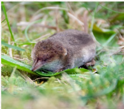
rejsek obecný – strana 86