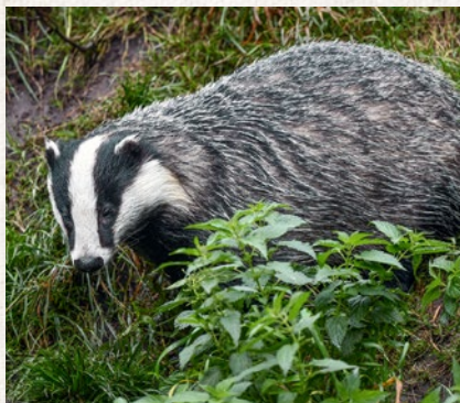
jezevec lesní – strana 88