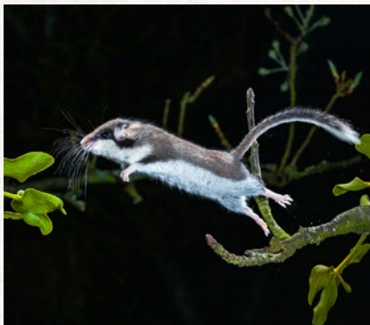
plch zahradní – strana 78