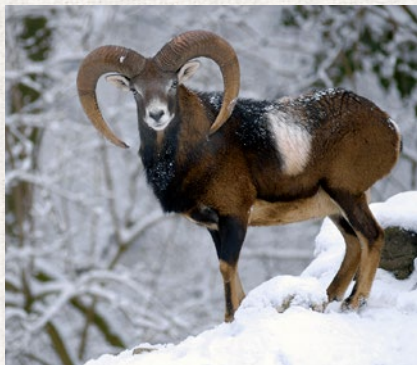
muflon – strana 72