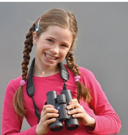
Triedry 7 × 42: kompromis mezi dobrým obrazem a hmotností

U desetinásobného zvětšení už mají někteří uživatelé obtíže s tím, aby triedry a tím i obraz udrželi v klidu. Průměry objektivu se pohybují zpravidla mezi 20 a 50 mm. Čím vyšší je číslo, tím je jasnější obraz, ale triedry je zároveň i větší, těžší a dražší. Triedry si nejprve vypůjčte a vyzkoušejte si, který by pro vás mohl být nejlepší. Spektiv je perfektním doplňkem především tehdy, když jsou zvířata velmi daleko.