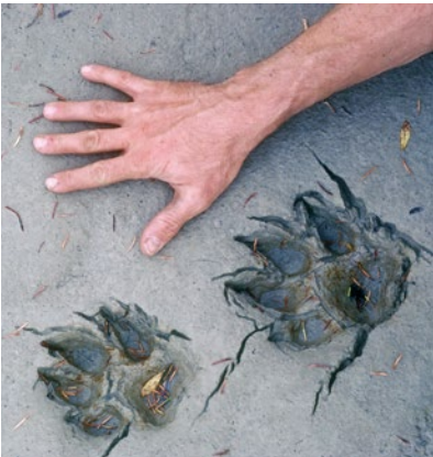
Analýza stop (zde vlčích) tvoří součást pozorování zvířat

Jakmile si osvojíte všechny potřebné dovednosti, zažijete na vlastní kůži to, co je ostatním dopřáno jen před televizní obrazovkou: smál jsem se kozorožci, který sklouzl po svahu, neboť si na jeho horní hraně zdřímá a ztratil tím rovnováhu. Vysvětloval jsem medvědovi klidným hlasem, že se naše cesty zkrížily jen náhodou a já už bych ho nechtěl dále rušit. (Myslím si, že to přijal s pochopením.) Byl jsem svědkem toho, jak vlk ukořistil vydru, a také vím, jak mlaská rejsec vodní, když si do své špičaté tlamičky snaží nasoukat ponravu. Takové zážitky jsou při pozorování savců pověstnými zlatými hřeby, nad nimiž člověk doslova zajásá!