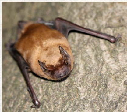
netopýr rezavý – strana 84