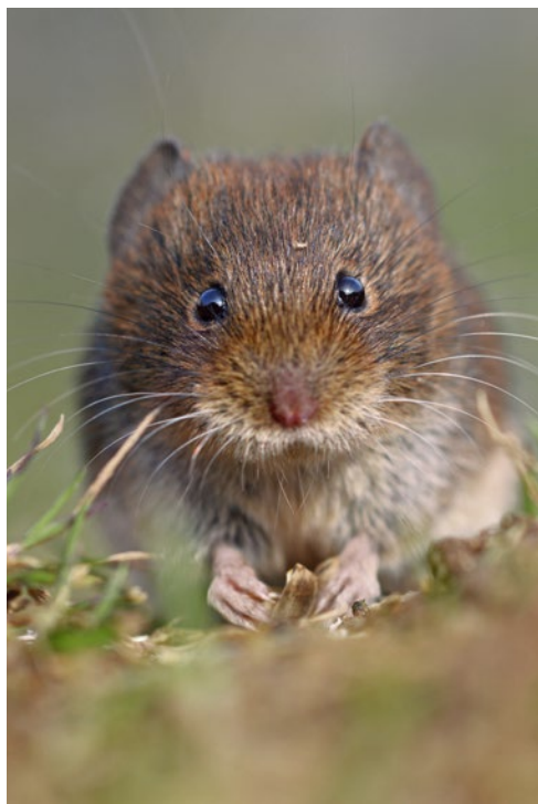
Při pozorování „myši“ je třeba nejprve určit druh

Jsem zpátky doma a prohlížím si své fotografie: moje myš je v porovnání s krysou,