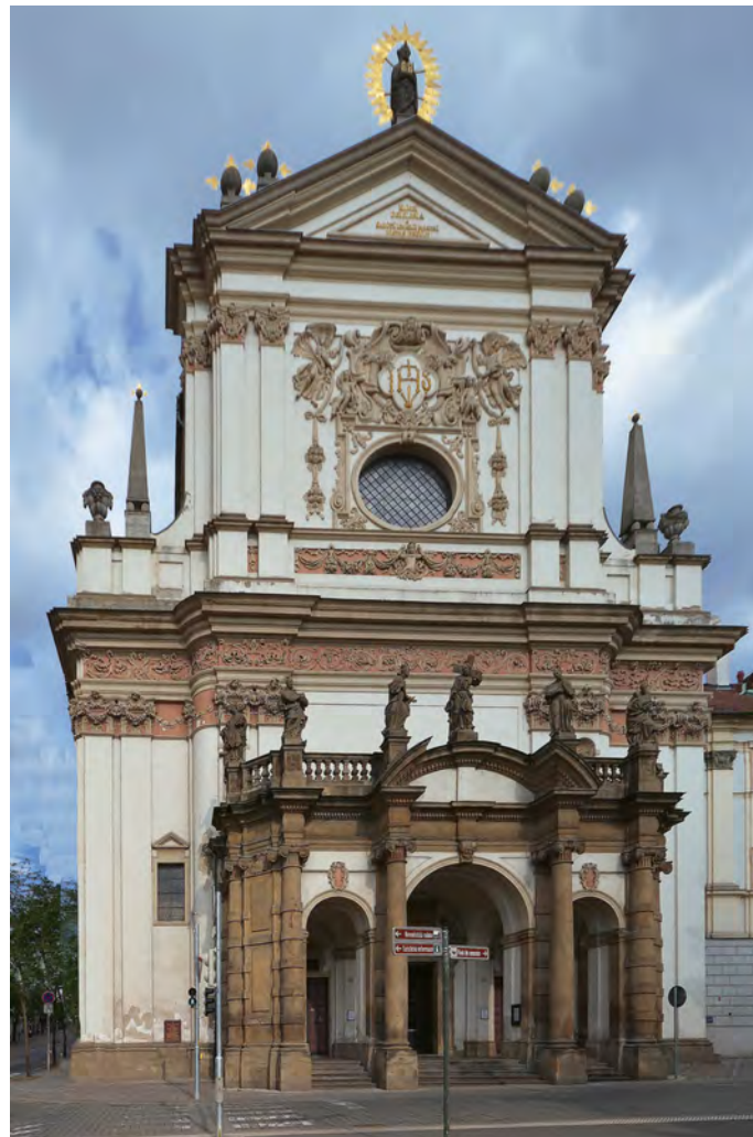
Projektem kostela sv. Ignáce z Loyoly na novoměstském Dobytím trhu (dnes Karlovo náměstí) uvádí Carlo Lurago do Prahy řadu pokročilých a zde nových slohových prvků

Barokní sloh se sice ve své rané podobě u nás projevil už v pobělohorském období (typicky na stavbách Albrechta z Valdštejna v Praze a Jičíně), teprve ve druhé polovině 17. století se však mohl plně rozvinout, aby na jeho sklonku dospěl k projevům reflektujícím vývojové směry a velká díla vrcholného baroka v Itálii. Centrem tohoto dění byla u nás samozřejmě Praha.