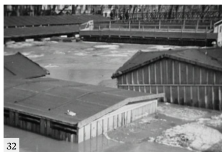
30, 31, 32 Mlejnek při dřenici.