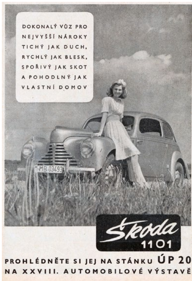
Lehce humorná reklama prodejny ÚP 20 ze Světa motorů z října 1947

děl 85 km/h. Jeho spotřeba benzínu se pohybovala mezi 9 až 11 l na 100 km. Automobily Škoda 1101 se představily světové veřejnosti v říjnu 1946 na prvním poválečném ročníku pařížského autosalonu. Byly označeny jako modely Škoda 1947 a vedle dvoudveřového uzavřeného modelu se tam objevil i dvoumístný roadster a čtyřdveřový polokabriolet s pevnými rámy dveří a oken a skládací textilní střechou. Toto provedení se však sériové výroby nedočkalo.