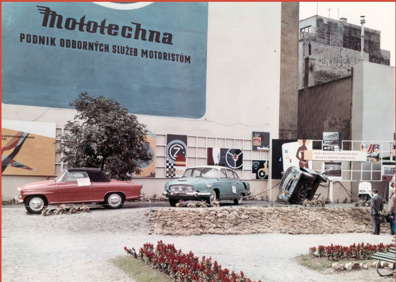
V létě 1960 vystavovala Mototechna vozidla na pražském Karlově náměstí

Poválečné počátky motorismu v Československu provázal nedostatek všeho. Od automobilů přes pneumatiky až po benzin. V roce 1946 v Mladé Boleslavi ze zbylých dílů smontovali posledních 250 malých vozů Popular 995 Liduška a na povolenky ministerstva dopravy je rozprodávali za 39 000 Kčs, ale bez pneumatik. Ty si zájemci museli opatřit sami.