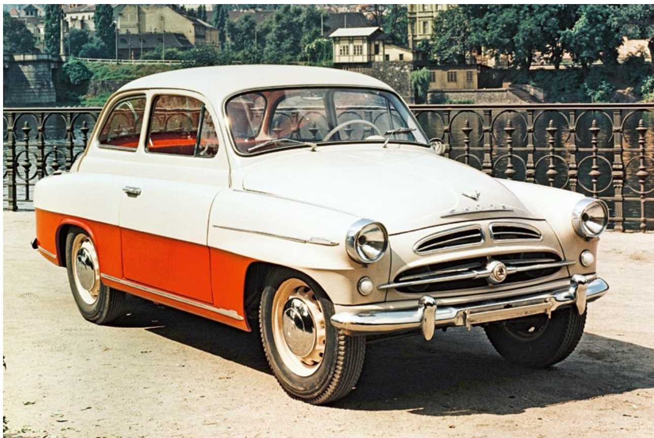
Škoda 445 Spartak vybavená motorem 1221 cm 3 o výkonu 45 k

Ve druhé polovině čtyřicátých let už československý automobilový průmysl podléhal centrálnímu řízení. Jeho výrobní program navazoval na předválečné konstrukce. Vozy Škoda měly nadále páteřový rám s centrální nosnou rourou, s nímž debutoval v roce 1934 model Popular, kopřivnická Tatra 87 se vzduchem chlazeným osmiválcem v zádi pokračovala téměř beze změny, nový vůz Tatraplan s plochým čtyřválcem také respektoval tradice značky. Novinkou vyvinutou za okupace byl malý vůz Minor s dvouválcovým motorem a předním pohonem.