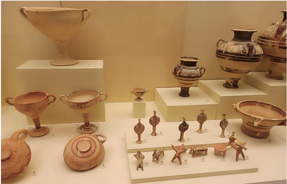
(Obr. 4) Poháry kylix a obětní figurky z Petsas house v dolním mykénském městě (vystaveno v Archeological Museum of Mycenae).

Zdejší dílny produkovaly tisíce kusů keramiky – především ušatých pohárů kylix – pro místní obyvatelstvo, palác či obchod s Kyprem i dalšími odbytími. Vyráběly se zde i figurky lidí a zvířat, s kultovní a votivní funkcí. Tento dům se nazývá v angličtině Petsas house po svém objeviteli a vzniknul během 14. stol. př. n. l.