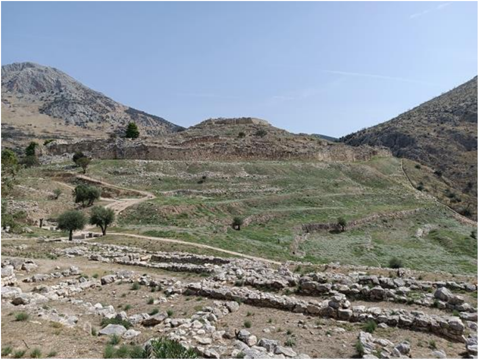
(Obr. 2) Mykénská akropole s pozůstatky kyklopských zdí na ostrožně mezi dvěma vrcholy.

Srdcem Mykén je citadela. Mohutná akropole obehnaná kyklopským zdívem. Ta je však domovem pouze elitní třídy obyvatel, vládnoucí vrstvě, horním „deseti procentům“. Kde žili ostatní lidé? Především v takzvaném dolním městě.