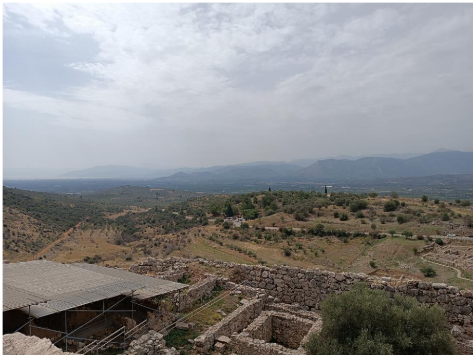
(Obr. 3) Argolida jako na dlani! V dáli je vidět pahorek Larissa a nižší Aspida, kde se rozkládal starověký Argos. Dohlédnout lze až k moři.

Odhaduje se, že akropole mohla mít koncem doby bronzové kolem 32 000 metrů čtverečních, tedy něco přes tři hektary. To odpovídá zhruba 4400 vozům Škoda Fabia zaparkovaným těsně u sebe anebo ploše 4,5 velkých mezinárodních fotbalových hřišť. Dolní město se za hradbami rozbíhalo na západ, severozápad a jihozápad. Z východu už totiž akropole přiléhala k strmému svahu kopce. Toto dolní město zabíralo kolem 30–32 ha plochy, bylo tedy 10krát větší než oblast akropole. Jinými slovy 45 fotbalových hřišť.