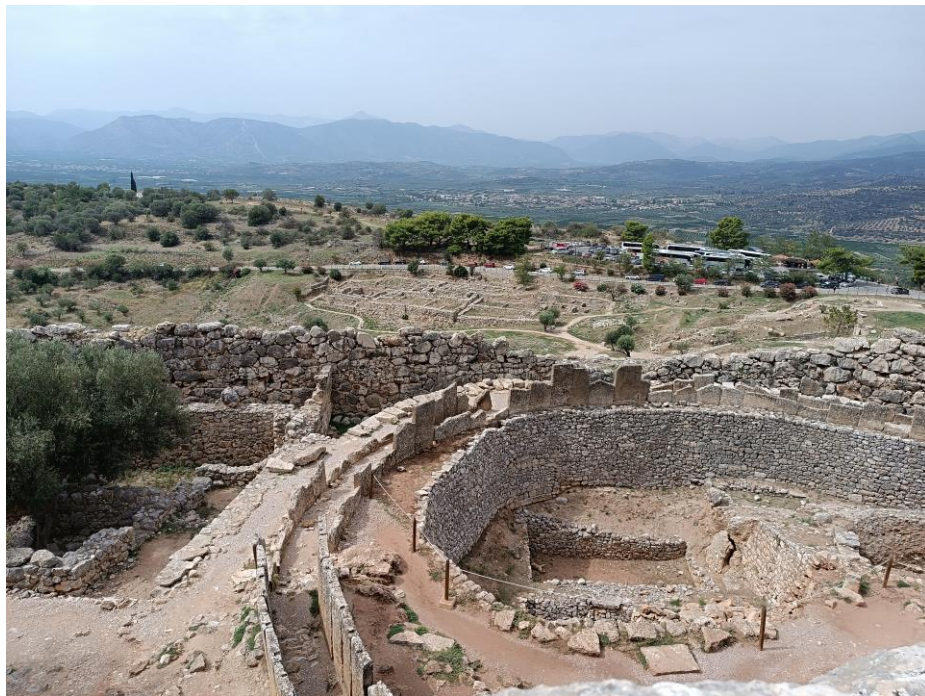
(Obr. 5) Hrobový okruh A se zbytky luxusního obložení. Dole pod hradbami pozůstatky sídel dolního města.

Jde o jednu z nejvýznamnějších lokalit svého typu z dané epochy v celém Řecku. Tvoří ji několik staveb. Součástí je chrám, svatyně i síň megaron , ale taky technické, skladovací a pracovní zázemí. Nachází se zde slavný „dům fresek“. Místo je s palácem spojené procesní cestou, která začíná dlouhou rampou. Cesta, nebo její část, byla zřejmě i zastřešená baldachýny, aby slavnostní průvody, které tudy o svátcích proudily, netrápilo ostré slunce nebo jiné rozmarné počasí.