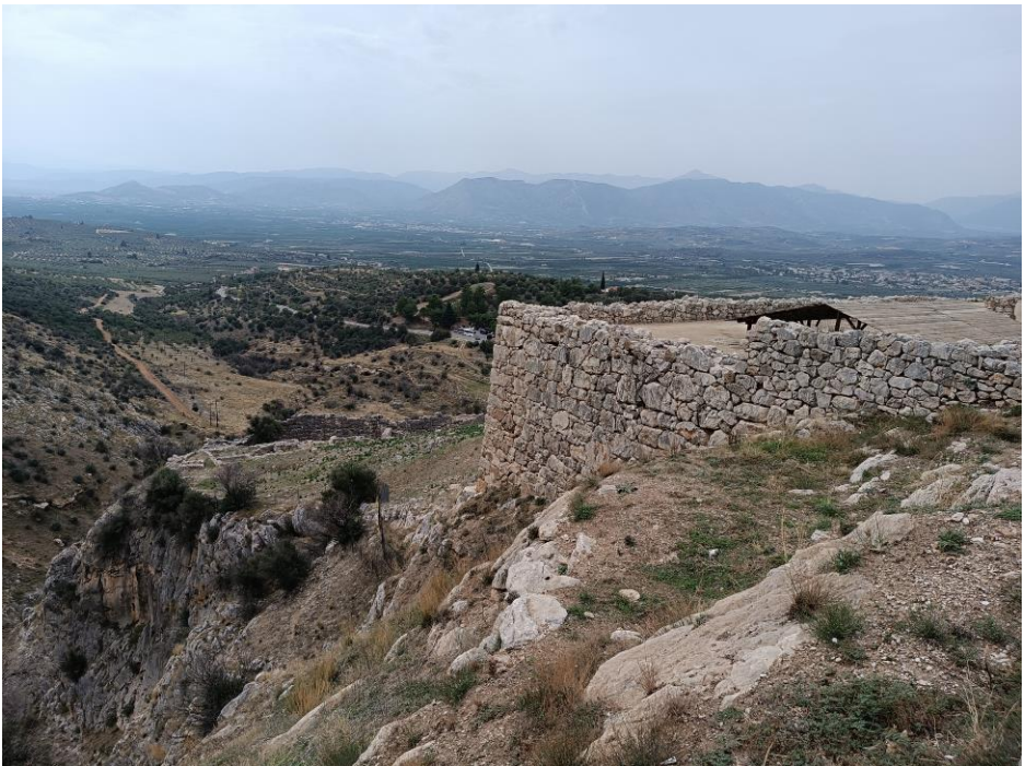
(Obr. 6) Pohled na zbytky megaronu. Síň končí na ostrém srázu. V místě přístřešku bývalo ohniště se čtyřmi sloupy.

Trůn je na stejném místě i v mykénském megaronu. Celý sál má rozměr 12,9 \times 11,5 m, což je téměř na chlup stejně jako v Pylu, ale i Tíryntu. Skoro to působí, jako by se megaron vyráběl coby polotovár z prefabrikovaných panelů (což se, pro jistotu říkám, pochopitelně nedělo). Centrum síně tvoří čtyři cca 4,5 m vysoké dřevěné sloupy na kamenných podstavcích ve čtvercové formaci kolem středového ohniště. To má průměr asi 3,4 m.