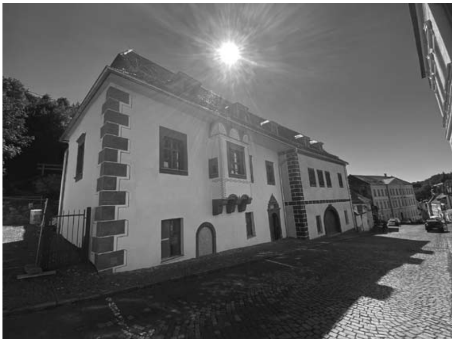
Baugmartnerov dom, kde bývali pred vojnou Polákovci – prvé okno na prízemí