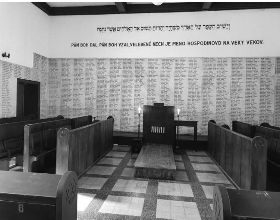
Zoznam obetí na stenách Domu smútku v Žiline