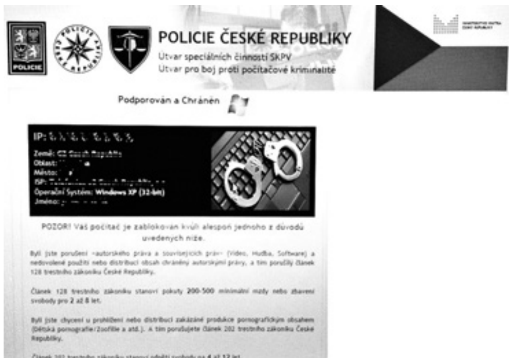
Obrázek 1.1: Ukázka ransomwaru

ném počítači často projevovaly různými zvukovými nebo obrazovými efekty, případně škodily ničením souborů a dat. V současnosti se naopak snaží chovat co nejméně nápadně a případně stahovat další nežádoucí a škodlivé programy do napadeného počítače. Viry představují velkou skupinu malwaru.