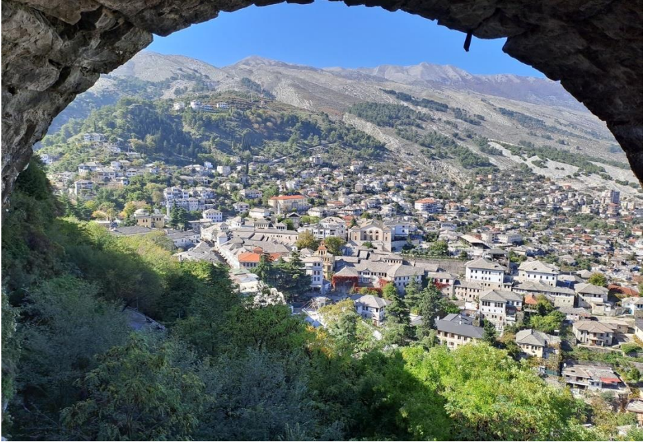
Pohled na městečko Gjirokastra z místního hradu.

Hledáte-li trochu dobrodružství spojenou s příjemnými zážitky s místními, chcete-li se vrátit na chvíli maličko do minulosti, pak je Albánie ta pravá destinace pro vaši příští cestu.