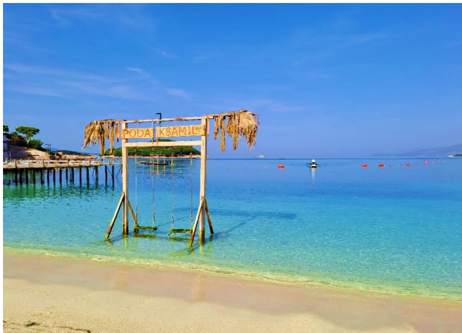
Albánské pláže připomínají Karibik.

Do Albánie mě to táhlo už dlouhé roky. V rámci Evropy se jedná o méně probádanou zemi, destinaci s nádechem exotična a neznáma. Tahle místa, kde nejsou davy turistů, mám moc rád, a tak nějak jsem tušil, že právě to mi Albánie poskytne. Když se potom po asi sté vlně