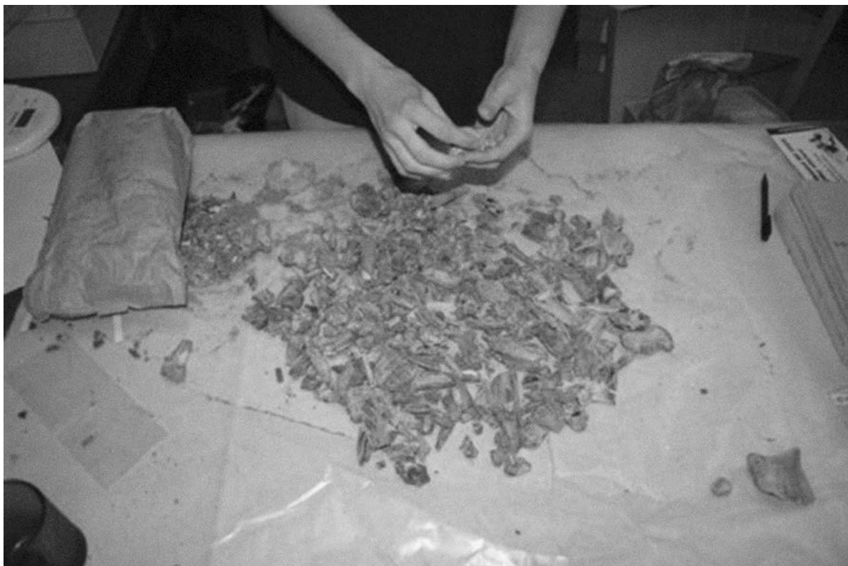
Obrázek 2: Fragmentarizace osteologického souboru PLH

cí kartáčku a pozvolné sušení. Následně byla kost označena číslem objektu, nebo číslem a písmenem čtverce a hloubkou nebo podúrovní.