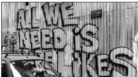
4| Osamělý měsíc bez sociálních sítí