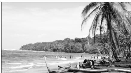
42| Prales Gandoka žije. Zatím.