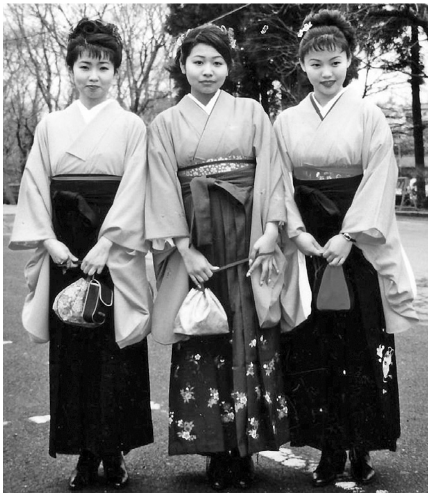
Čerstvé absolventky tokijské univerzity.

Oděv univerzitního profesorského sboru je sice středověký, členové akademické obce měli dokonce za povinnost i oděvem se odlišovat od ostatních obyvatel, ale přesto se během věků měnil. Černé či barevné obřadní pláště – později nazývané pallioly – profesorů, doktorů a magistrů včetně rektorova hermelínového límce na červeném