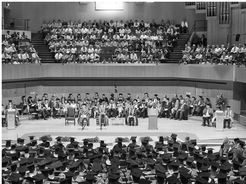
Promoce na univerzitě v Cardiffu.

Každý z nás, kdo má akademický titul, to zažil. Každý byl uchvácen onou starobylou atmosférou, která nás během tohoto slavnostního