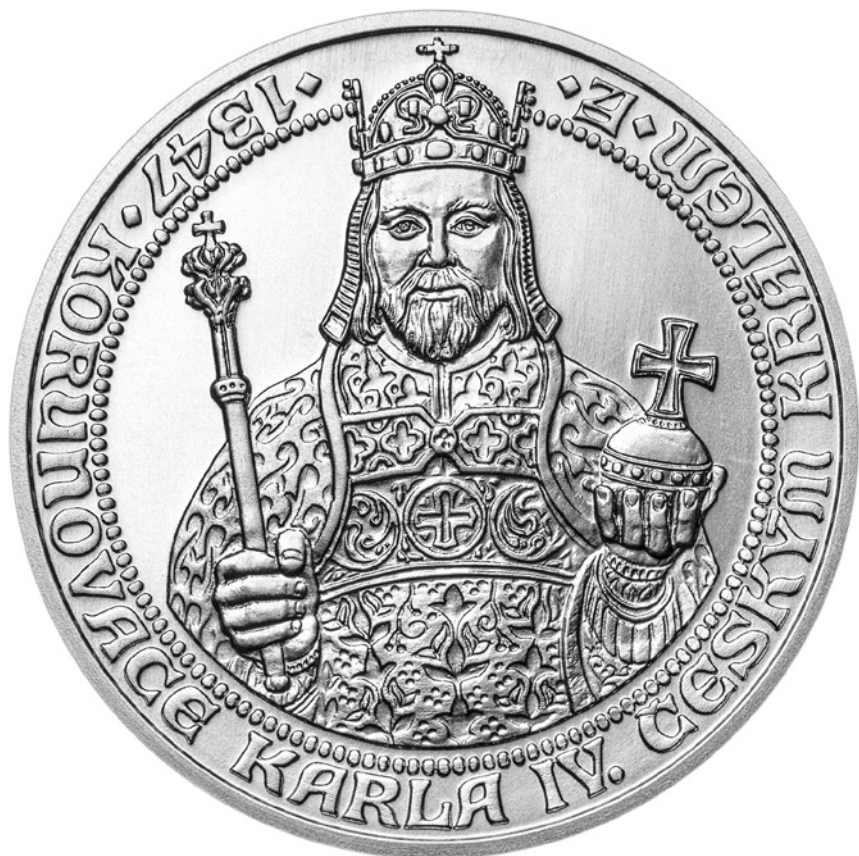
Korunovace Karla IV.