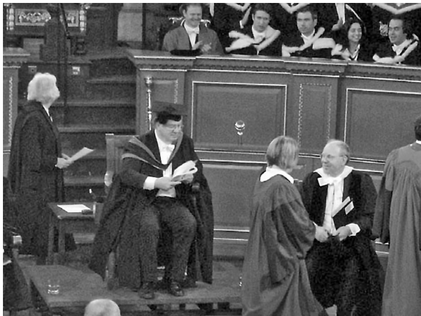
Promoce na oxfordské univerzitě.