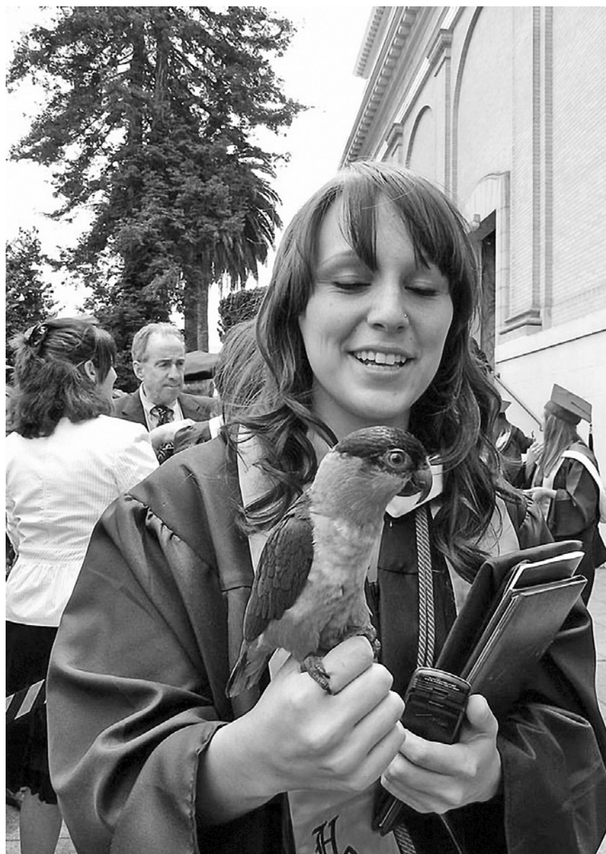
Před (nebo po?) promoci v San Francisku.