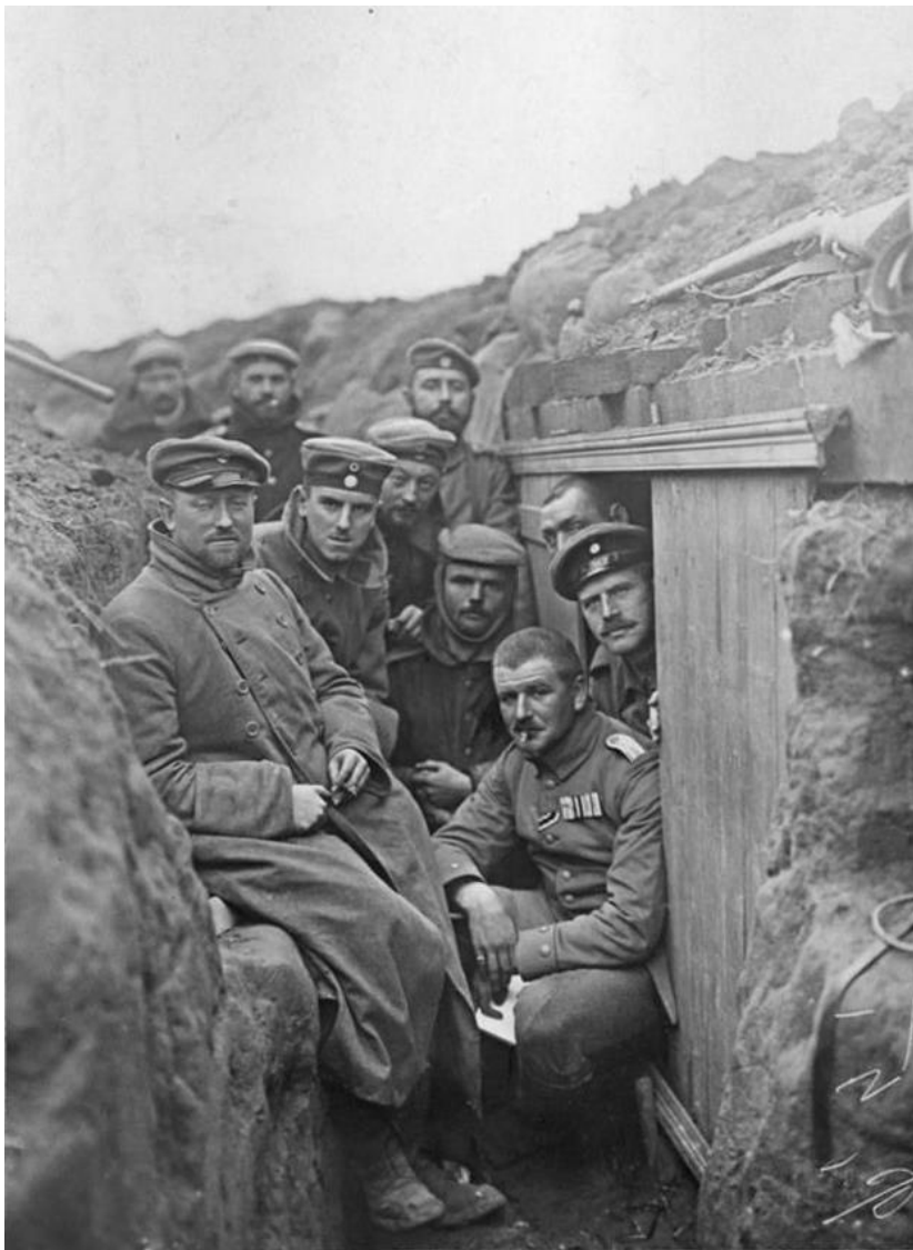
Němci pózuji v zákopech během bitvy u Yper