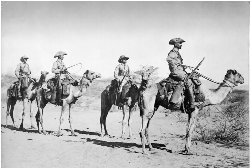
Obr. 1 - Německá velbloudí patrola