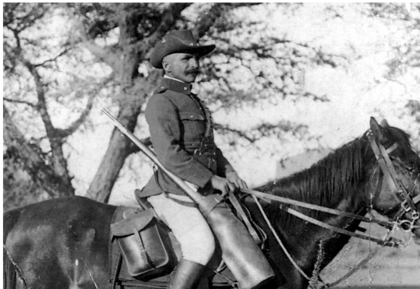
Voják německé kavalerie krátce před bitvou