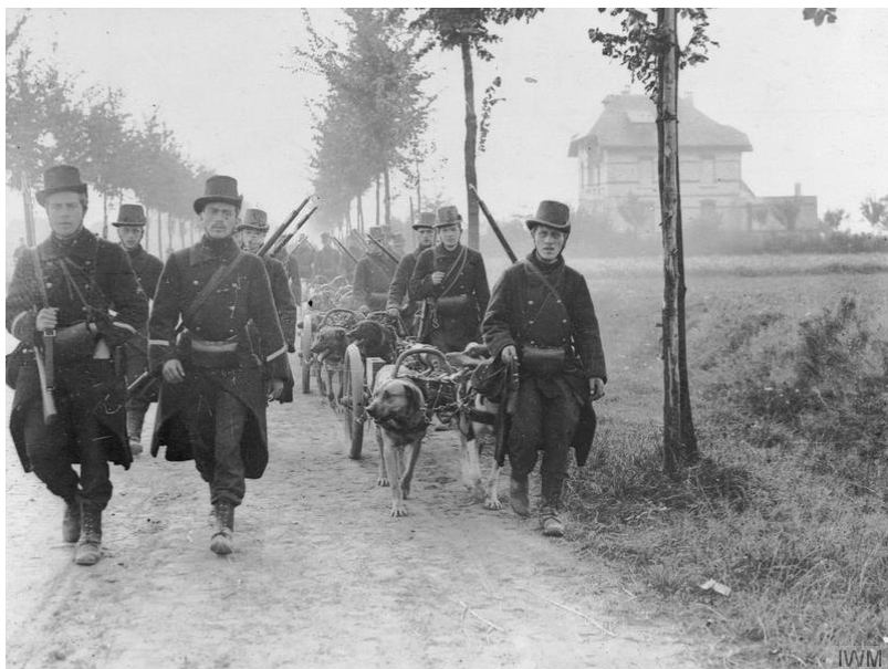
Belgické kulomety tažené psím spřežením