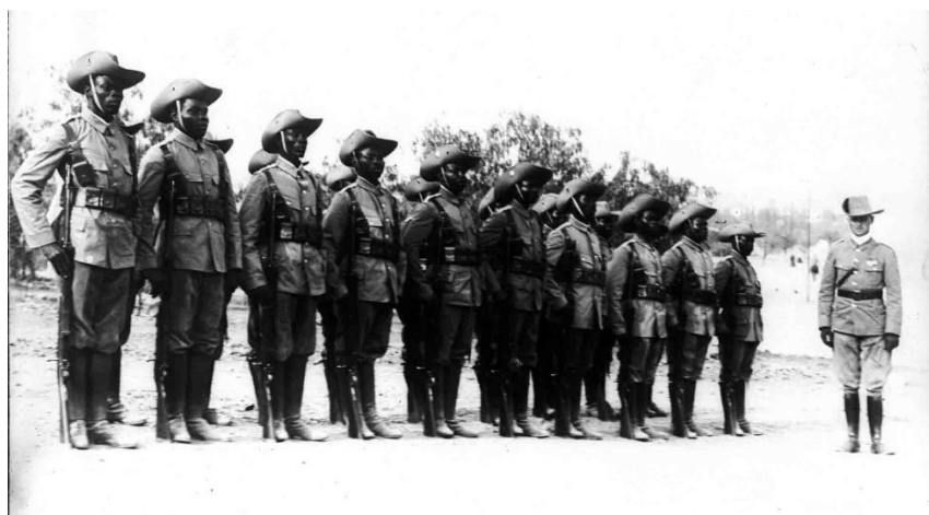
Koloniální jednotky byly často vedené zkušeným německým důstojníkem.