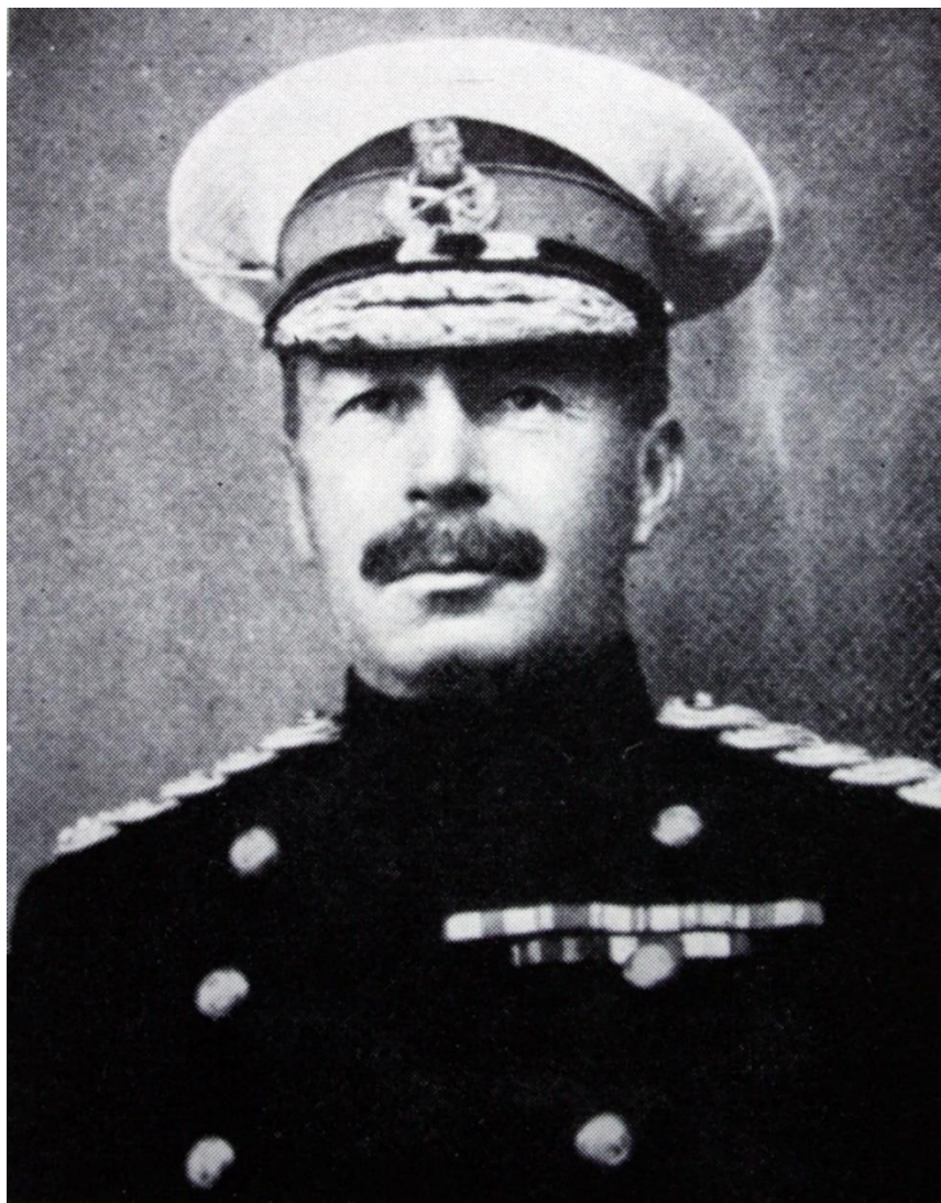
Sir Henry Timson Lukin