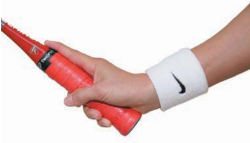
Špatný úchop - ukazováček nedrží rukojeť, je za ni pouze zapřen