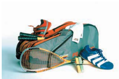
Vybavení na squash

Raketu je třeba si vždy vyzkoušet, každému vyhovují jiné vlastnosti. Musíme se s ní cítit především pohodlně. Vlastnosti, ke kterým bychom měli při koupi přihlédnout, jsou váha, velikost hlavy a vyvážení. Začátečníci, kteří nechtějí utratit hodně peněz, určitě vystačí s levnou (méně kvalitní) raketou. Jak budou více pronikat do hry, zjistí, že kvalitnější raketa vylepšuje komfort a přesnost jejich hry.