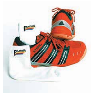
Boty na squash