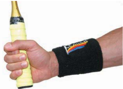
Špatný úchop - kladivovité držení - mezi ukazováčkem a prostředníkem není žádná mezera

Jedna z možností, jak ovlivňovat samotný úder, je natočení hlavy rakety vzhledem k přední stěně – rozlišujeme otevřenou a zavřenou pozici rakety. Obecně se squash hraje otevřenou raketou – šetříme tak síly a bez větších potíží umísťujeme míček do zadní části kurtu. Zavřená pozice se používá hlavně při útočných úderech.