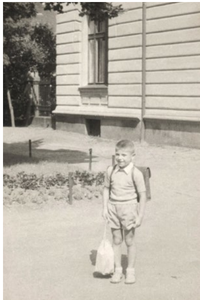
Základní devítiletá škola

Začal bych tím, že jsem se narodil v Pardubicích a mám o tři roky mladšího bratra. Ten je ovšem zcela jinak založený. Asi jen díky tomu jsme se odmalička rvali a dohadovali, třeba o to, kdo bude mít větší kus jídla. Ale také jsem slyšel, že se vlastně všichni sourozenci takhle dohadují, perou a závidí si. Asi ta nejzásadnější věc, ve které jsme se lišili, byla, že já jsem měl velký zájem o vzdělávání a o pořádek, takže odmalička, aniž by mě to nějak zvlášť rodiče nařizovali anebo učili, jsem si věci rovnal. A co jsem chtěl, tak jsem vždy našel. Možná na to měl velký vliv Jaroslav Foglar, jehož knihy mě nesmírně zaujaly. Všechny jsem je přečetl, a měl jsem dokonce ve své skříňce pověšený od něj převzatý citát jako krédo svého života: Buď vždy spravedlivým a čestným, buď mužem.