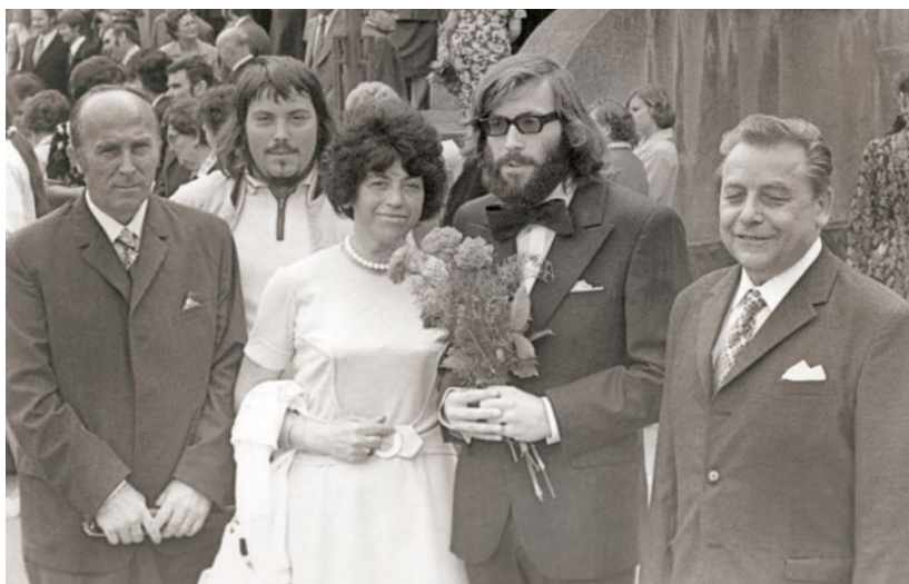
Po promoci s rodinou

Také jsem ještě netušil, jak žena ve všech partiích vypadá, byla to jen taková přirozená přitažlivost mezi děvčaty a chlapci. Pamatuji si, že se mi líbila ve třídě jedna