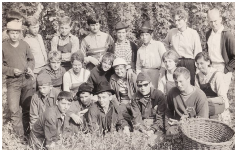
Na chmelu před střední školou

Důležitým zlomem v mém životě byla 8. třída. Do té doby jsem byl takové ucho, ostříhaný na ježka, kterého děvčata vůbec nezajímají. A pak ještě druhá věc, totiž že moje maminka, která dříve tancovala, ale potom měla problém se srdcem,