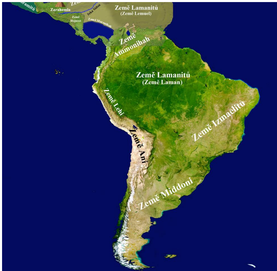
Základní mapy k fiktivním americkým dějinám v Knize Mormonově

Abyste se lépe orientovali v místech a postavách, vytvořil vám Martin Č. tyto fantastické mapy a přehledné tabulky. Jediné, co by vás mohlo zarazit, je tzv. Země Lamanitů (Země Lemuel), která je dnes pod vodou. Podle Knihy Mormonovy k tomu došlo během katastrof spojených s ukřižováním Ježíše Krista.