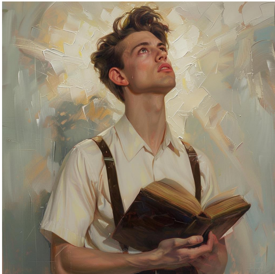
Chlapec a jeho zjevení