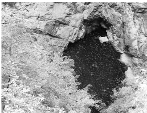
Hranické jezírko v současnosti