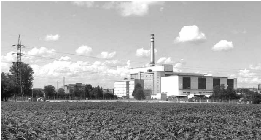
Elektrárna v současnosti. Tato fotografie neměla vzniknout.

A ono to funguje. Dostávám datum a hodinu, kdy se mám dostavit do Bratislavy ke generálnímu řediteli. Nejde mi o nic jiného než potřást si s panem ředitelem pravicí, vysvětlit mu, kdo jsem, co dělám a o co by mi šlo a poprosit ho, jestli by se třeba nezamyslel, zda by to někdy v budoucnu za nějakých okolností nešlo aspoň částečně zrealizovat.