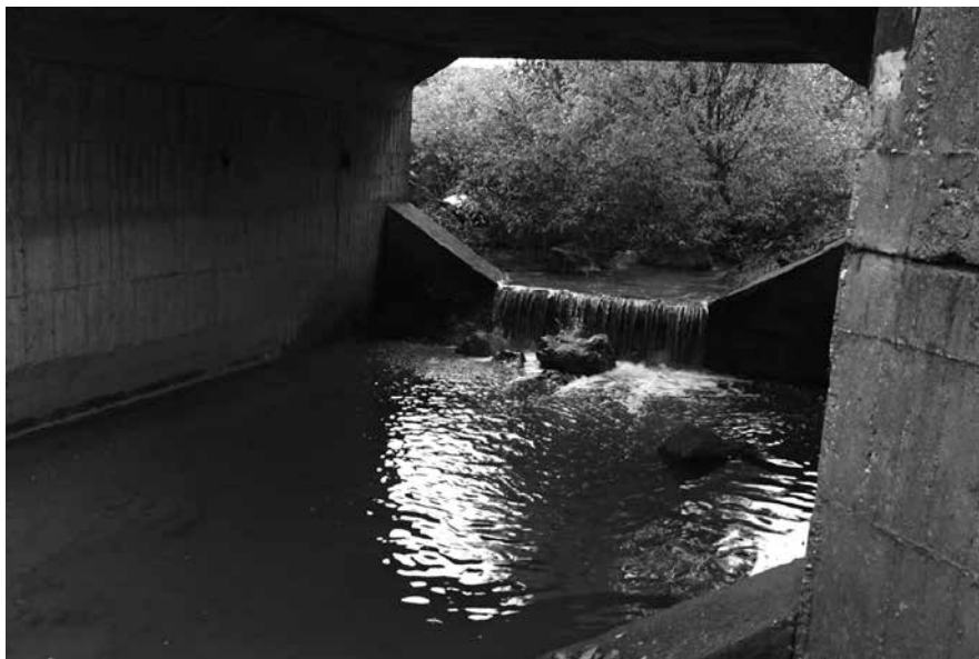
Most přes potok Manivier.

že při masivním úniku by bylo ohroženo až 100 000 lidí. A že dál po proudu je na Váhu vodárenská nádrž Králová. Ale ani únik ze začátku prosince 1985 nebyl jediný, dokonce nebyl jediný v tom roce. Radiace unikla v roce 1985 ještě nejméně třikrát. Nejméně. Ve výpisu se hovoří i o uvažovaném vytvoření sekundární bariéry pro kontaminovanou vodu. Ta ovšem postavena nebyla.