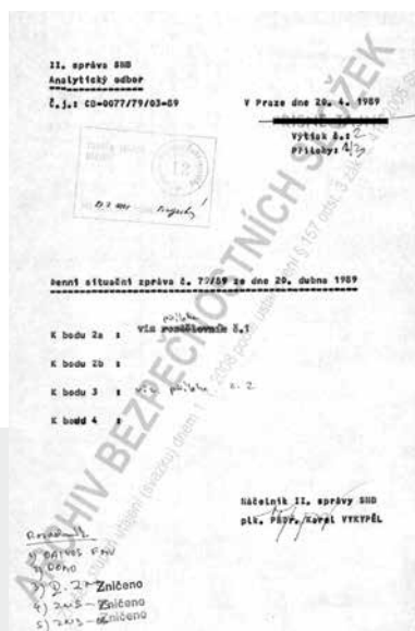
Denní hlášení StB z 20. dubna 1989.

Dne 25. 1. 1989 o 14:05 při pravidelné dozimetrické kontrole na stanici odpadních vod A1 a V-1 v atomové elektrárně Jaslovské Bohunice bylo zaznamenáno překročení koncentračního limitu radioaktivity vypouštěných odpadních vod.