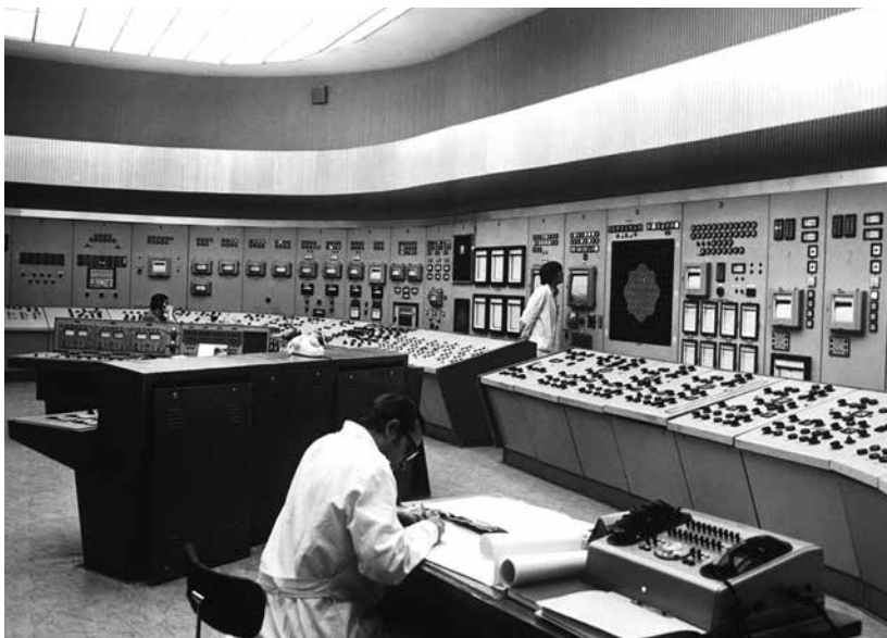
Na blokové dozorně nikdo nebyl.

Vyšetřovatelé pracují s verzí, že k úniku radiace došlo kolem 14:00 hod., kdy se střídaly směny a na velíně nikdo nebyl. Jenže únik musel přijít o dost dřív a odstavená elektrárna byla bez dozoru evidentně déle.