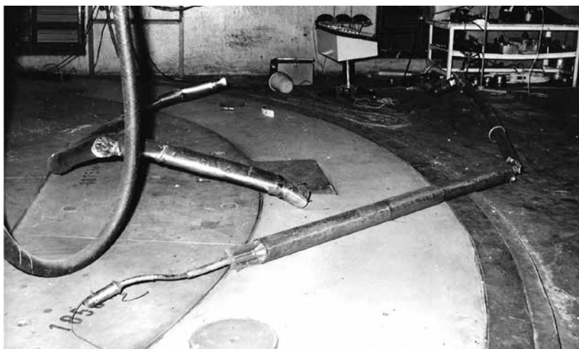
Vystřelený palivový článek.

zorně usuzují, že jedinou možností je „ucpat“ volný otvor zavážecím strojem. Po třičtvrtě hodině se daří obsluze zavážecího stroje otvor utěsnit částečně a po dalších necelých dvaceti minutách úplně. Chladicí plyn není naštěstí příliš radioaktivní. Úrovně radiace v některých částech elektrárny překročily normu přibližně stonásobně. Čtyřidvacetihodinové limity pro únik radioaktivních plynů do okolí nejsou překročeny, limity pro aerosoly jsou překročeny jen mírně. Většina pracovníků elektrárny je dekontaminována na elektrárně, více zasažení pracovníci reaktorové haly ve zdravotním středisku.