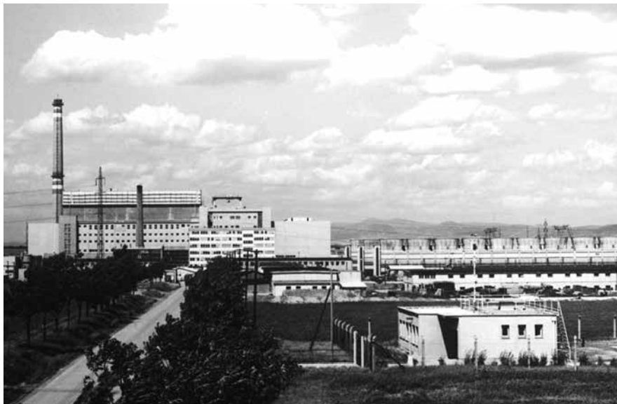
Elektrárna A1 po svém dokončení.

analogicky postavit jadernou elektrárnu vedle dolů uranových. Jednoduché, až geniální.