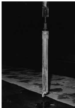
Přepálený paliivový článek po vytažení z reaktoru.

Nepochybují o tom, že o mé žádosti, o mém záměru, se ve společnosti kromě mluvčí nedozvěděl vůbec nikdo. Vedení JAVYSu se nicméně zná s lidmi z branže, se kterými se znám i já, s nimiž jsme už na několika věcech spolupracovali a mohou nás propojit a poskytnout na mě reference.