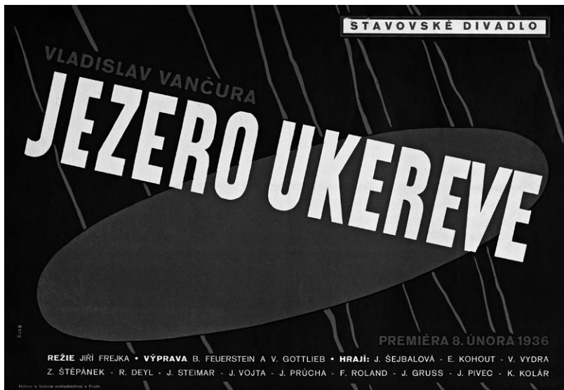
Affiche de Jaroslav Šváb pour la première.