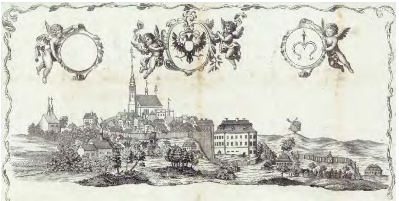
Bílovec před 1808, pohled od JZ (znaky rakouské monarchie a Bílovce), cech. list, anonym, mědiryt, 35,5 × 16,5, SOKA Liberec, fond Cech soukeníků Liberec, i. č. 58, kart. 9