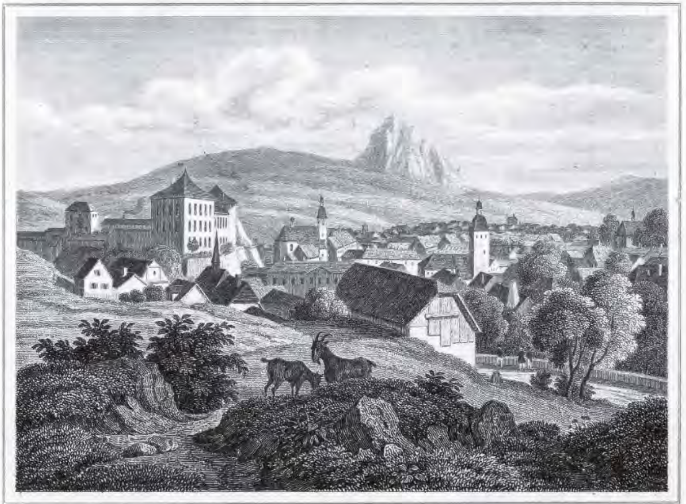
Bílina 1843, pohled od SZ, Wenzel Pobuda, mědiryt, 10 × 7,5, knižní ilustrace, volné dílo, archiv autora