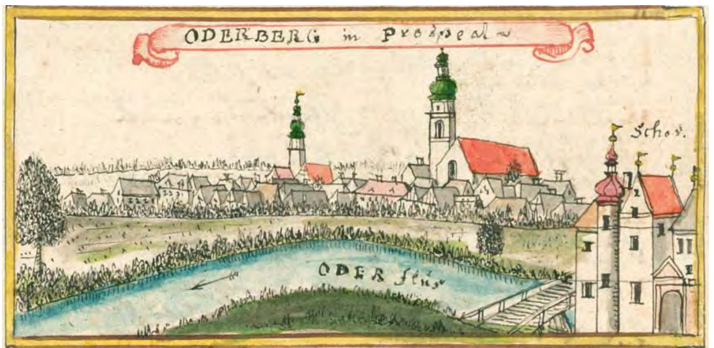
Bohumín 1762–1768, pohled od Z (na Starý Bohumín , ODERBERG in prospect), F. B. Werner, kolor. kresba, 17 × 8,5, soubor TopSl, volné dílo, archiv autora