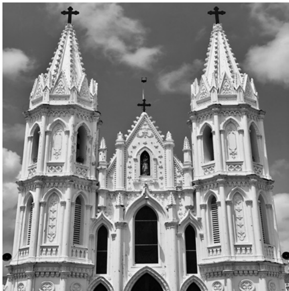
Gotická Bazilika Panny Márie, Matky dobrého zdravia vo Vailankanni

menší objem mlieka a opísal, čo sa mu cestou prihodi- lo. Keď sa muž pozrel do nádoby s mliekom, zistil, že je plná, a uvedomil si, že sa stal zázrak. Nádrž, kde sa Panna Mária zjavila, sa nazýva cisterna Panny Márie. Druhé zjavenie sa uskutočnilo o niekoľko rokov, keď sa Panna Mária zjavila chlapcovi s postihnutím, ktorý