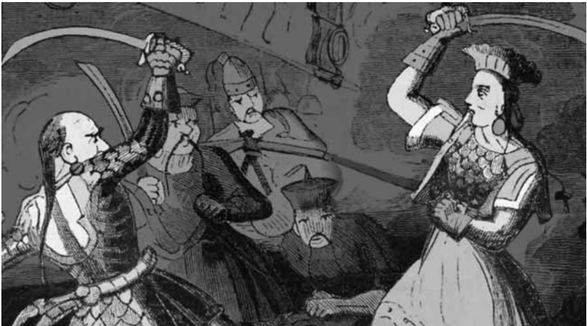
Zheng Yi Sao na ilustrácii z knihy z roku 1836.

Zheng Yi Sao alebo Madame Zheng sa narodila v Číne koncom 18. storočia do nesmiernej chudoby, čo ju priviedlo k najstaršiemu remeslu. Ako prostitútka, našťastie, nepracovala dlho. Jeden z jej zákazníkov, pirát Zheng Yi, si ju vzal za manželku. S istotou to nevieme, no zdá sa, že išlo o manželstvo z rozumu. Zheng