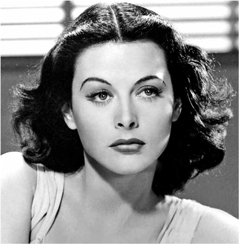
Hedy Lamarr v špionážnom filme Comrade X z roku 1940.

od detstva prejavovala neuveriteľný talent v mnohých oblastiach. Vedela hrať na klavír, venovala sa baletu, hovorila tromi jazykmi a mala neuveriteľné technické nadanie. Nakoniec sa rozhodla pre kariéru herečky a takmer okamžite sa stala hviezdou. Dodnes je považovaná za jednu z najatraktívnejších filmových herečiek vôbec.