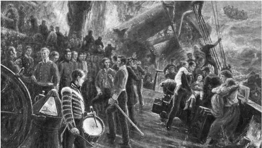
Stroskotanie lode Birkenhead na obraze Thomasa Hemyho z roku 1852.

Jeden z francúzskych cestujúcich navrhol kapitánovi, aby sa najprv postarali o ženy a deti. Kapitán súhlasil. Kým sa ženy a deti nalodžovali do záchranného člna, muži ostali na palube hasiť oheň. Tento postup zaujal svetové médiá a čoskoro sa o ich džentlmenstve písalo v novinách v Spojených štátoch, vo Francúzsku aj vo Veľkej Británii, čo svedčí o tom, že nešlo o štandardný postup.