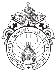
Erb Peregrinatio ad Petri Sedem (púte do Petrovho sídlu)

Ríma, ktorý spočíva v pochopení mučeníctva. V tomto zmysle cieľ putovania prorocky koriguje aj mentalitu súčasného postmoderného človeka i kresťana, u ktorého „vydávanie svedectva o viere sa stáva stále ťažkopádnejším, unaveným a ľahostajným“. 10 Túžba hľadať pravdu viery je od pradávna cieľom každého človeka, nielen pútnika. 11 Preto cieľ putovania – hľadať v Ríme Cirkev mučeníkov – je protipólom k opísaným trendom „sekularizácie spásy“. 12 Napríklad už tým, že s putovaním je tradične spojená fyzická i duchovná námaha ako i prekonávanie rôznych prekážok.