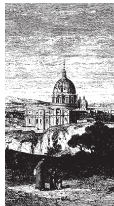
Rímska bazilika okolo roku 1870 (ešte izolovaná na vidieku Ríma)

O tomto meste právom platí, že „Rím nie je hocaké mesto, nikdy nebolo a nikdy ani nebude – v dobrom i zlom zostane jedinečným mestom na svete“, a preto „myslieť na Rím ako na mesto s osobitným povolaním nie je nezvyčajná myšlienka“. 9 Výnimočnosť Ríma nie je primárne povahy geografickej, kultúrnej či jurisdikčnej, ale povahy teologickej. V Ríme je prítomná Cirkev opísaná na priečelí Lateránskej baziliky slovami: „ Omnium urbium et orbis ecclesiarum mater et caput “ (matka a hlava cirkvi všetkých miest a sveta). Tento nárok je daný „genetickým kódom“ Ríma, ktorým je mučeníctvo a prítomnosť mučeníkov: „kresťanské mesto sa zrodilo v tieni slávy mučeníkov“. Tieto skutočnosti definujú zmysel putovania do