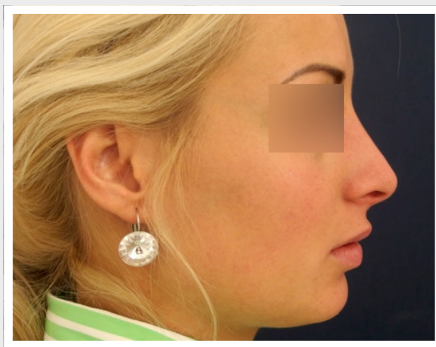
Obr. 3 Stav před operací nosu a po ní