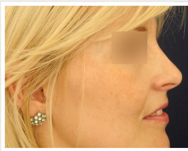
Obr. 4 Stav před operací nosu a po ní