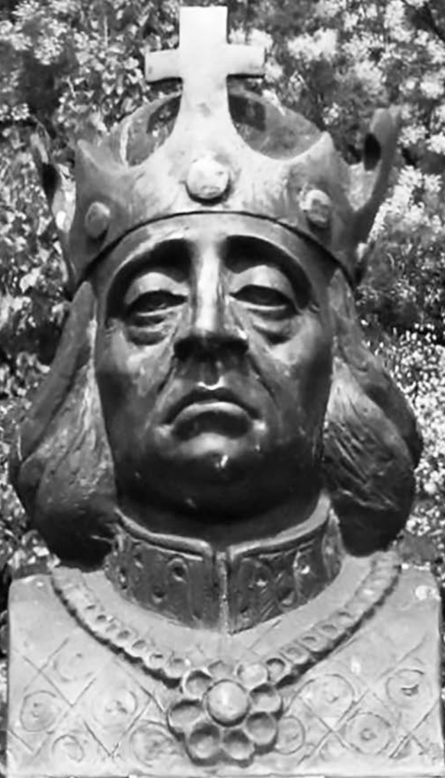
Uhorský kráľ Belo IV., busta v národnom historickom parku, Ópusztaszer, Maďarsko.