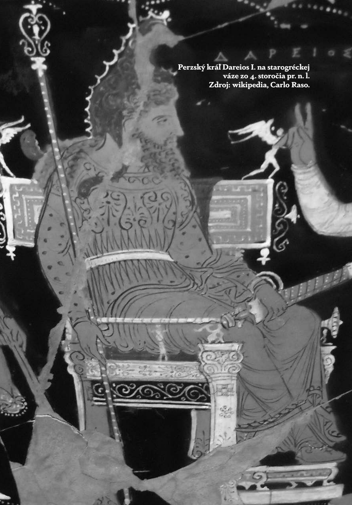
Perzský král Dareios I. na starogréckej váze zo 4. storočia pr. n. l.