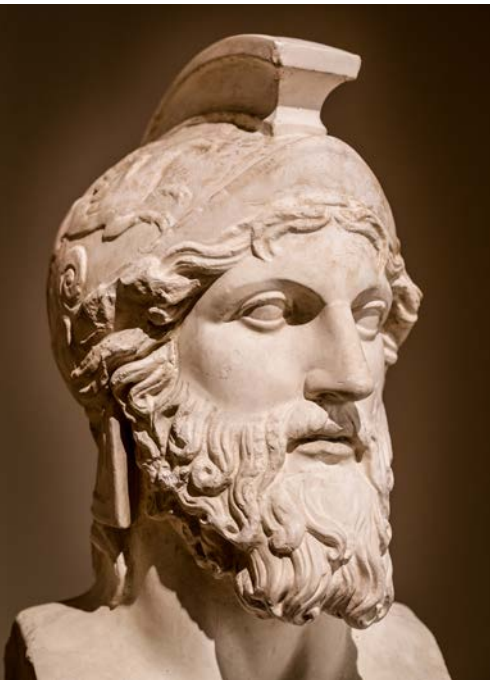
Aténsky vojvodca Miltiades (antická busta zrejme zo 4. storočia pr. n. l.)

Pre Aténčanov sa ponúkali v zásade dve možné riešenia: obrana v opevnenom meste alebo bitka v poli. Vzhľadom na obmedzenosť zdrojov a malé rozmery Attiky