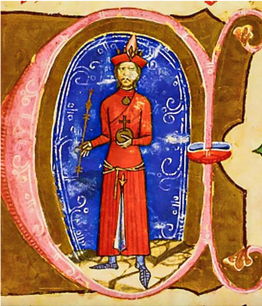
Ladislav IV. Kumánsky podľa viedenskej Obrázkovej kroniky. Zdroj: wikipedia, Kálti Márk – Chronicon Pictum.

IV. slúži, že výzvy Zlatej hordy podriadiť sa a poskytnúť jej podporu na ďalšie vpády do Európy odmietol. V roku 1259 sa Zlatá horda transformovala na prakticky nezávislý štát s vlastnou politikou a jej vojská takmer beztriestne podnikali nájazdy do Poľska, do krajín na Balkáne, Kaukaze a vo Východnej Európe vrátane Litvy.