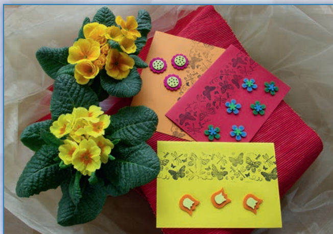
Přáníčka s plstěnými ozdobami