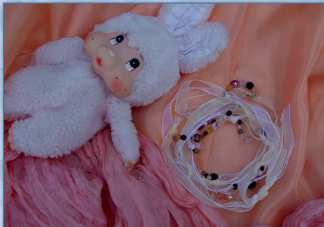
Korálky pro malou princeznu