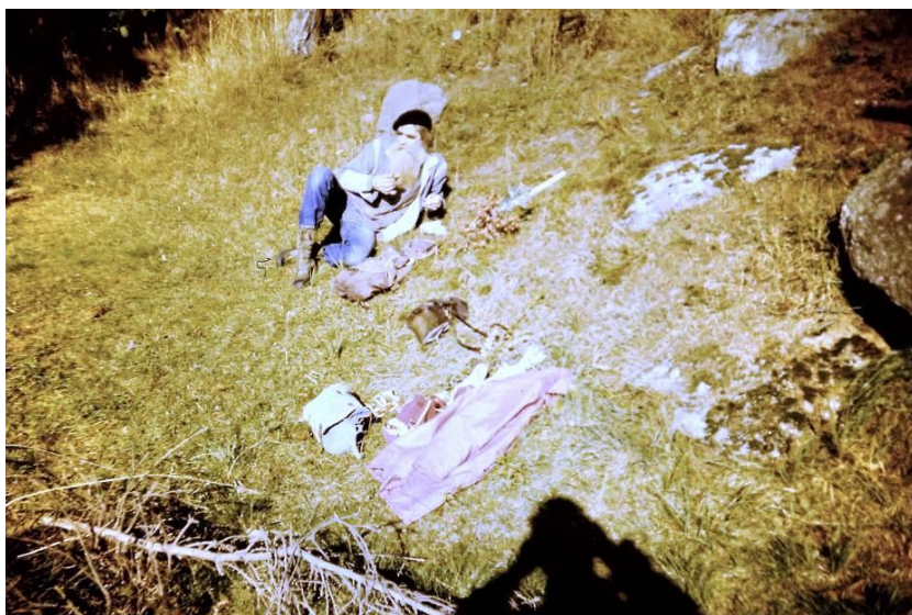
„Dušičky“ na řece Oslavě, kousek od Tasova 1987