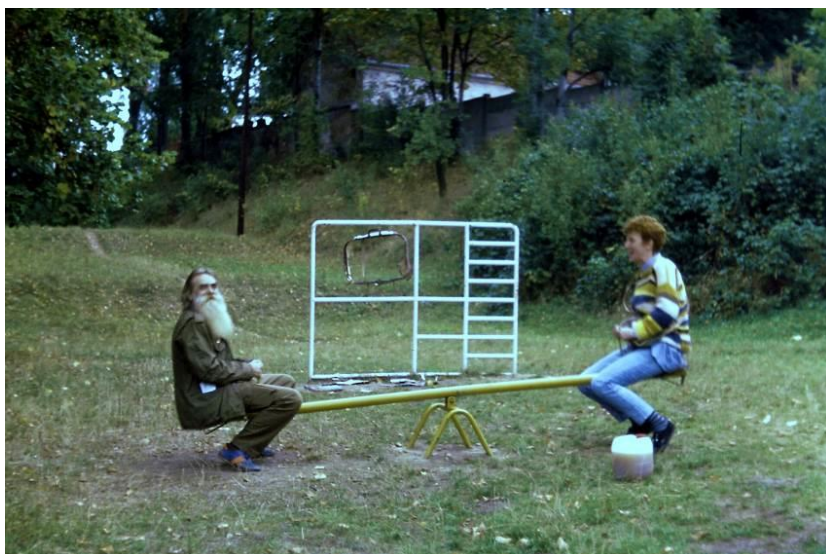
U Tišnovského nádraží 1992