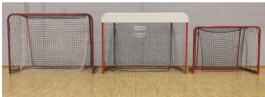
Velikosti florbalových branek