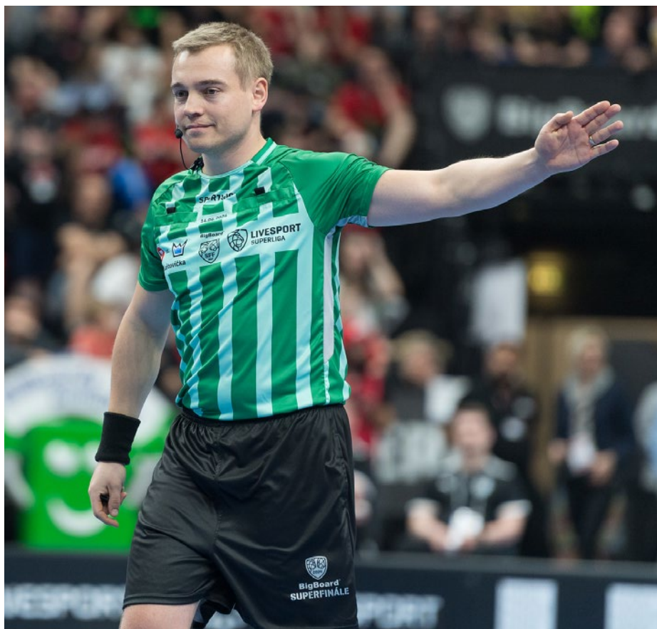
Rozhodčí ve florbale