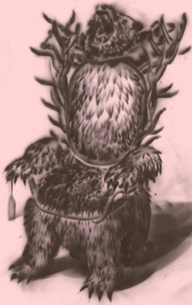
1.1 Trón Pán lesa. Poťah z kožušiny z medvedia bneďého, svišťa a vlka. Rámi: mahagónové drevo a parožie. Podšívka: polyester.