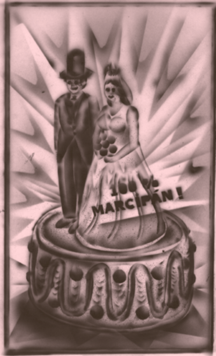
0.5 Jednopočetná svadobná torta s LED prekami.