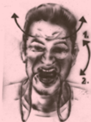
0.8 Posilňovač mimických svalov pre dokonalý úsmev.