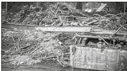
29| Povodně Řeka Opava u Široké Nivy, foto: Jana K. Kudrnová.