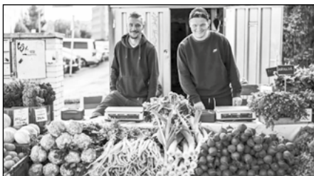
15| Lokálně a farmářsky, online i osobně Farmářský trh Kubáň, foto: farmarskestrziste.cz.