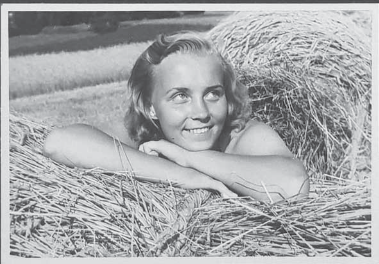
Stránka starého albumu