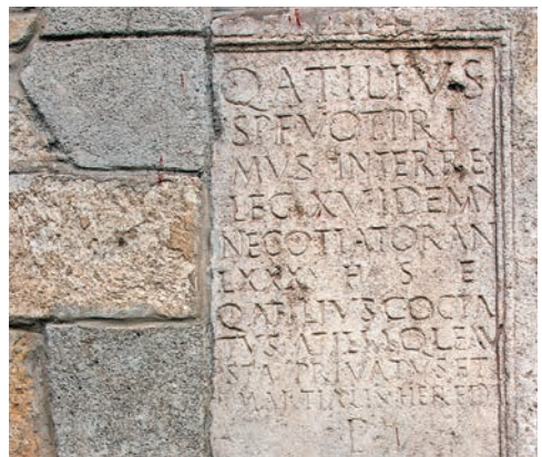
Rímsky náhrobok v Boldogu