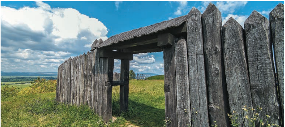
Veľkomoravský dvorec Kostolec nad Ducovým

hradisku s centrálnou funkciou. Jeho dôležitosť podčiarkuje prítomnosť kamenného kostola. Napriek tomu sa ešte nezavrholo, že by Rastislavova Dowina mohla byť na neďalekom Sandbergu, kde sa podarilo preskúmať zvyšky dvoch susediacich hradísk. Návšteva tohto očarujúceho miesta nad neďalekou Devínskou Novou Vsou by však mohla poslúžiť na zamyslenie sa aj nad spomínaným obdobím.