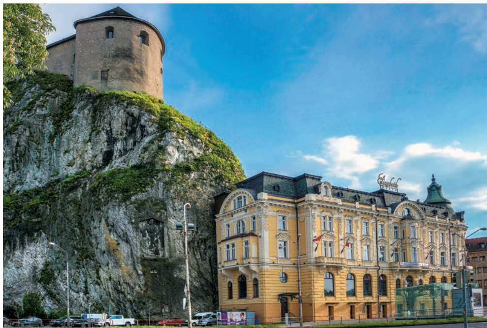
Hotel Elizabeth v Trenčíne