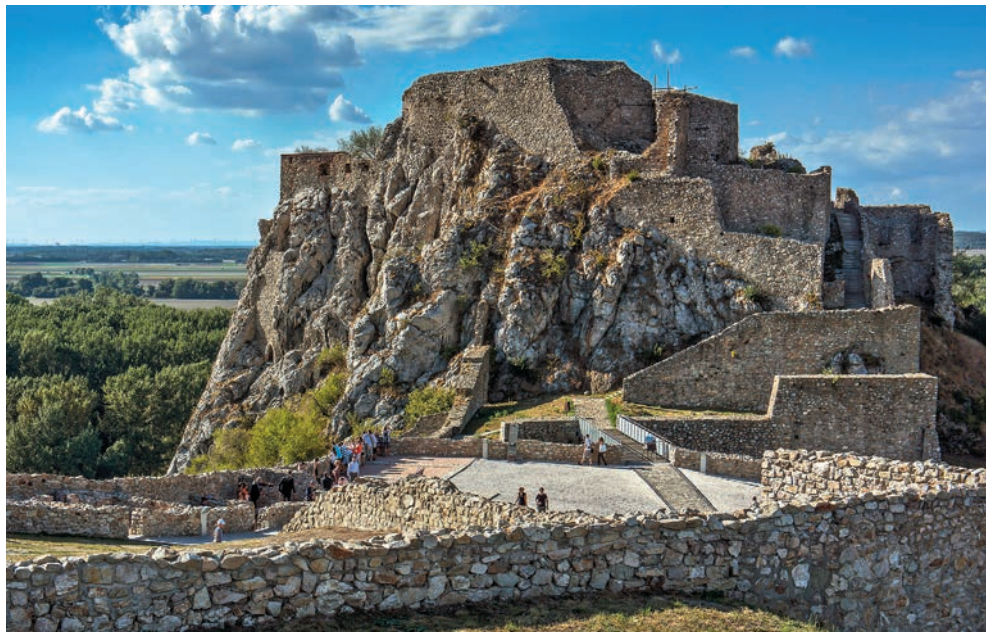
Horný hrad na Devíne

dodržiavať. Zároveň si vydobyl cirkevnú nezávislosť umožňujúcu pokračovanie misie vierozvestov sv. Cyrila a Metoda.