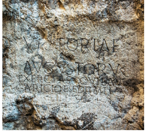
Rímsky nápis v Trenčíne

Pamiatky na pôsobenie rímskych legionárov sa sústreďujú na území západného Slovenska. Rímsky nápis o tábore Laugaricio nájdeme pri trenčianskom hoteli Elizabeth. Pozostatky kastelu Gerulata sa nachádzajú v bratislavskej mestskej časti Rusovce. Okrem vykopávok tábora Kelemantia pri Iži sa oplatí navštíviť aj Rímske lapidárium v Komárne umiestnené v Bašte VI vonkajšej časti komárňanskej pevnosti. Podobnú stélu ako v kostole v Boldogu pri Senci môžeme obdivovať aj v murive kostola v Semerove pri Nových Zámkoch a v kostole v Želiezovciach bol rímsky sarkofág použitý ako oltárna menza. Villa rustica pri bratislavskej Dúbravke a základy rímskej vily pri Stupave nám zase pripomínajú civilné stavby z rímskych čias.