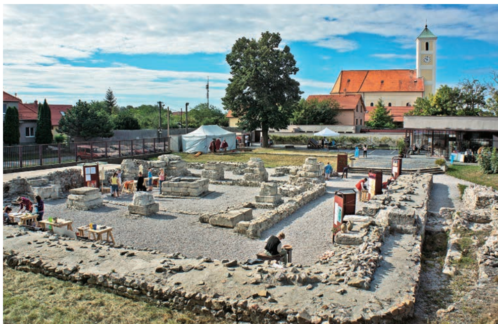
Rímsky kastel Gerulata

O tri roky neskôr sa proti Dákom rovnakým smerom vydal na čele rímskeho vojska legát Marcus Vinicius. Obsadením pravobrežnej časti Podunajska sa medzi Sávou a Dunajom vytvorila nová rímska provincia Panónia s hlavným mestom Carnuntum. Severná hranica provincie a zároveň aj Rímskej ríše sa na niekoľko storočí ustálila na strednom toku