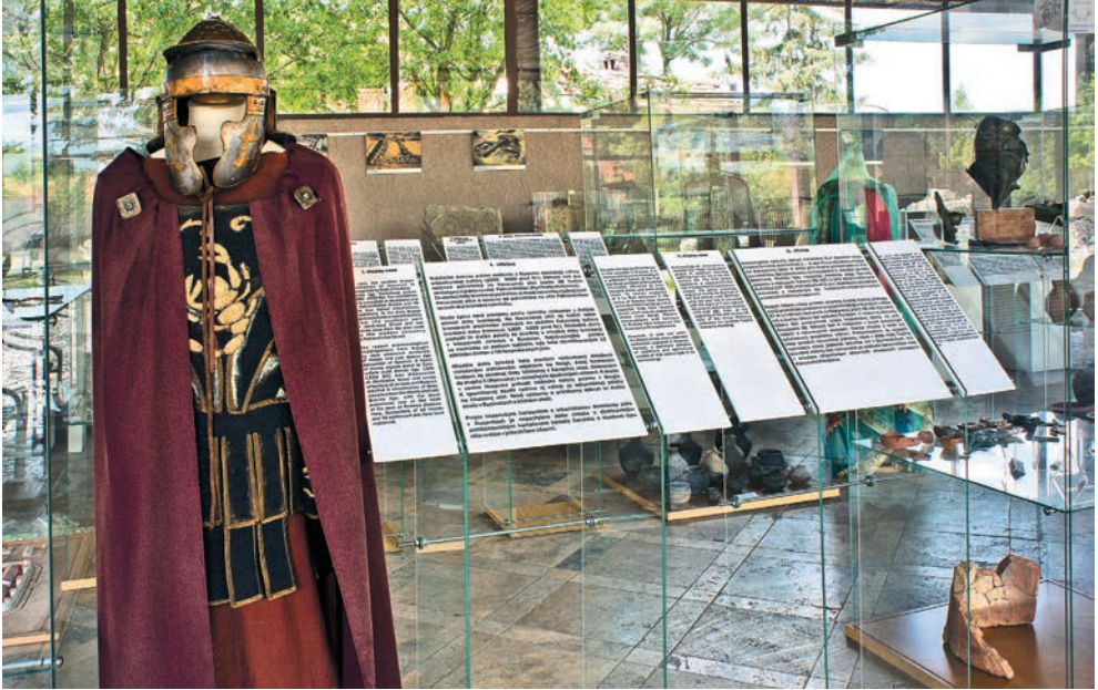
Antická Gerulata – expozícia Múzea mesta Bratislavy

Dunaja. Chránil ju pevnostný systém nazývaný Limes Romanus . Podľa takto vytýčenej hranice sa rozlohou malá časť zadunajskej Bratislavy stala súčasťou rímskeho impéria, zatiaľ čo zvyšok Slovenska vrátane ľavobrežnej časti Bratislavy bol územím mimo ríše obývaným barbarskými kmeňmi Markomanov a Kvádov.