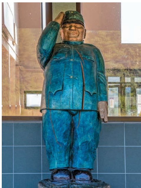
Socha Švejka na stanici v Medzilaborciach

hrdinu cez Radvaň nad Laborcom do poľského mesta Sanok. Od roku 2008 má humenský Švejka bračeka, podobnú sochu z dreva odhalili na železničnej stanici v Medzilaborciach.