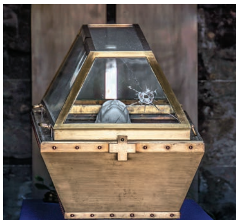
Mauzóleum Andreja Hlinku v Ružomberku

truhla so skleneným vekom v roku 1945 týždeň v Prezidentskom paláci. Keď sa ju nepodarilo odviezť do Rakúska, údajne ju uložili do katakomb pod Dómom sv. Martina, kde sa však neskôr už nenašla. Pravdepodobne ju zničili príslušníci ŠtB, aby sa zabránilo uctievaniu Hlinkovej pamiatky.