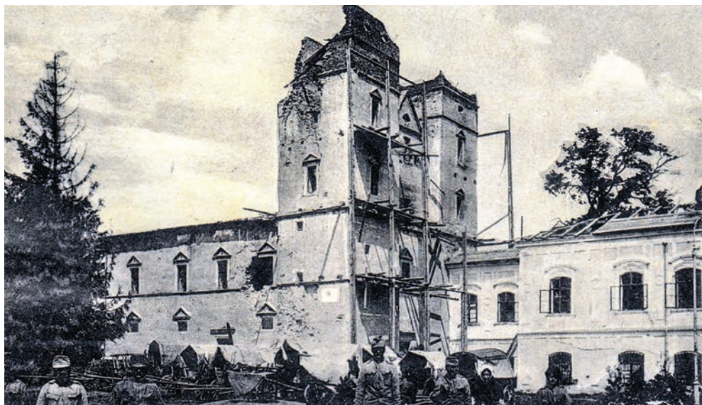
Rákócziho kaštieľ v Zborove v roku 1916

vojaci boli nasadzovaní do najťažších frontových úsekov, a preto tvorili až 80 percent padlých vojakov 71. prešporského pešieho pluku.