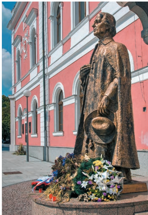
Socha Andreja Hlinku v Ružomberku

Ak sa vydáme po stopách černovskej tragédie, nemusíme opustiť chotár Ružomberka. Černová sa medzitým stala jeho mestskou časťou. Z diaľky uvidíme dominantný Kostol Panny Márie Ružencovej, ktorý bol jablkom sváru tragickej udalosti z roku 1907. V deň 25. výročia bol za prítomnosti Andreja Hlinku odhalený pamätník s menoslovom obetí. V Černovej možno navštíviť rodný dom Andreja Hlinku s malou expozíciou o jeho živote a diele. V spleti Školských schodov pod farským Kostolom sv. Ondreja v Ružomberku sa nachádza Mauzóleum Andreja Hlinku. Jeho socha kráši západnú terasu nad schodiskom a mnoho ďalších Hlinkových podobizní odhalených po novembri 1989 je prakticky po celom Slovensku.