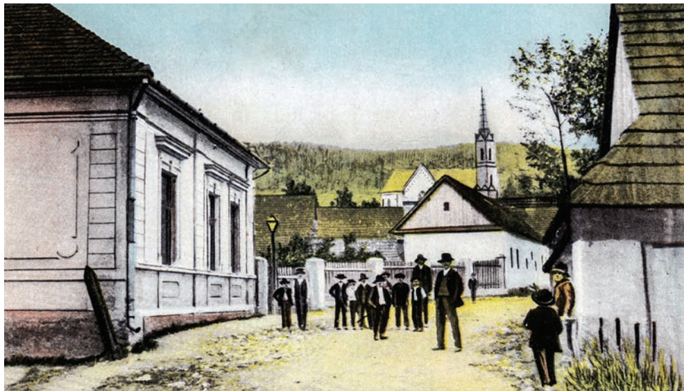
Černová s kostolom v pozadí v roku 1911