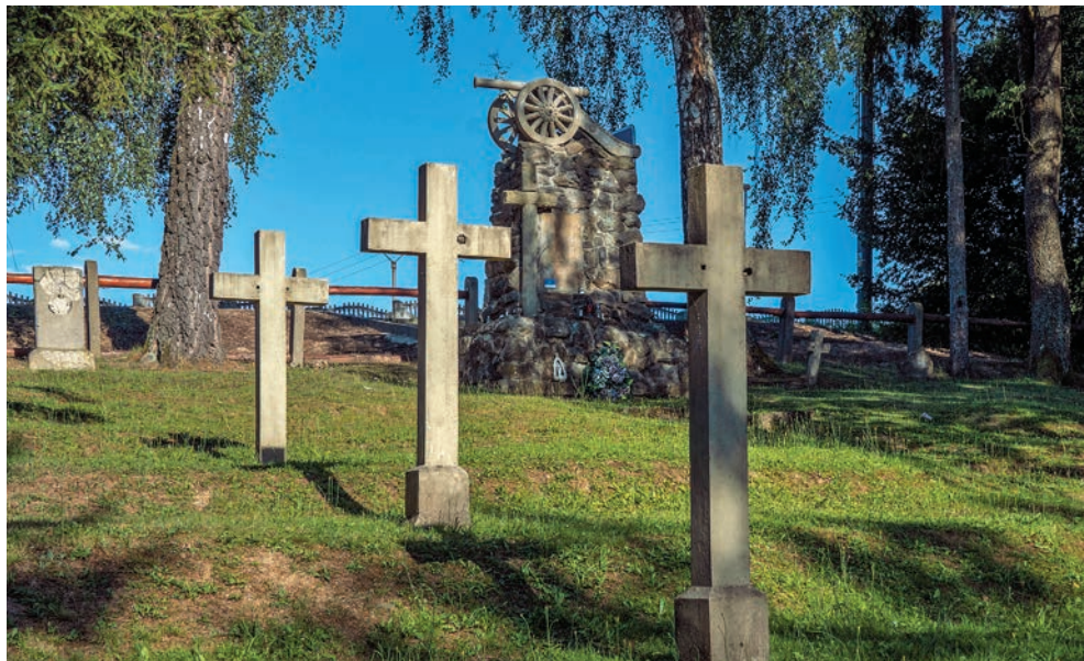
Vojenský cintorín v Medzilaborciach

Keď sa 1. až 4. augusta 1914 do vojny zapojili svetové mocnosti (na stranu Rakúsko-Uhorska sa postavilo Nemecko a na strane Srbska bojovali Francúzsko, Rusko a Veľká Británia), hrozba celosvetového vojnového konfliktu sa naplnila. Pre vojakov mobilizovaných z územia dnešného Slovenska sa však hlavným bojiskom na dlhé tri roky