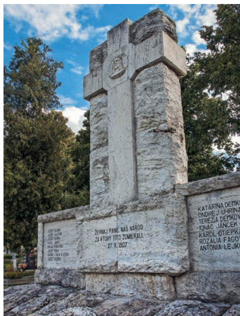
Pamätník černojskej tragédie v Černovej

na číslo 15. Okrem toho bolo dvanásť černojských občanov vážne zranených a desiatky ďalších utrpeli rozličné ľahšie poranenia.