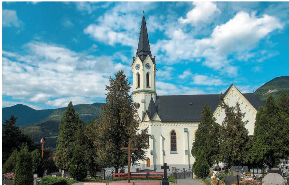
Kostol Panny Márie Ružencovej v Černovej

pobúrených ľudí, čo sa mu však najmä pre neznaosť slovenčiny nepodarilo.