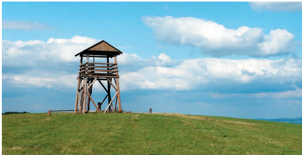
Rozhľadňa na Žalostinej

čo však zďaleka nie sú jediné dominanty mesta. Rotunda pochádza z 12. storočia a je najstaršou historicko-architektonickou pamiatkou Skalice. Pred ňou stojí tzv. Severná brána, ktorú ako súčasť mestského opevnenia vybudovali po roku 1372. Z ďalších pamiatok vymenujme aspoň zopár: farský Kostol sv. Michala Archanjela, Kostol sv. Františka Xaverského, jezuitský kostol, františkánsky kostol či Kostol Najsvätejšej Trojice, kde nájdeme vzácnu sochu Lorentánskej Panny Márie z čierneho ebenového dreva. K pozoruhodnostiam mesta patria aj klasicistická kalvária, historická budova Domu kultúry alebo pamätník venovaný J. A. Komenskému.