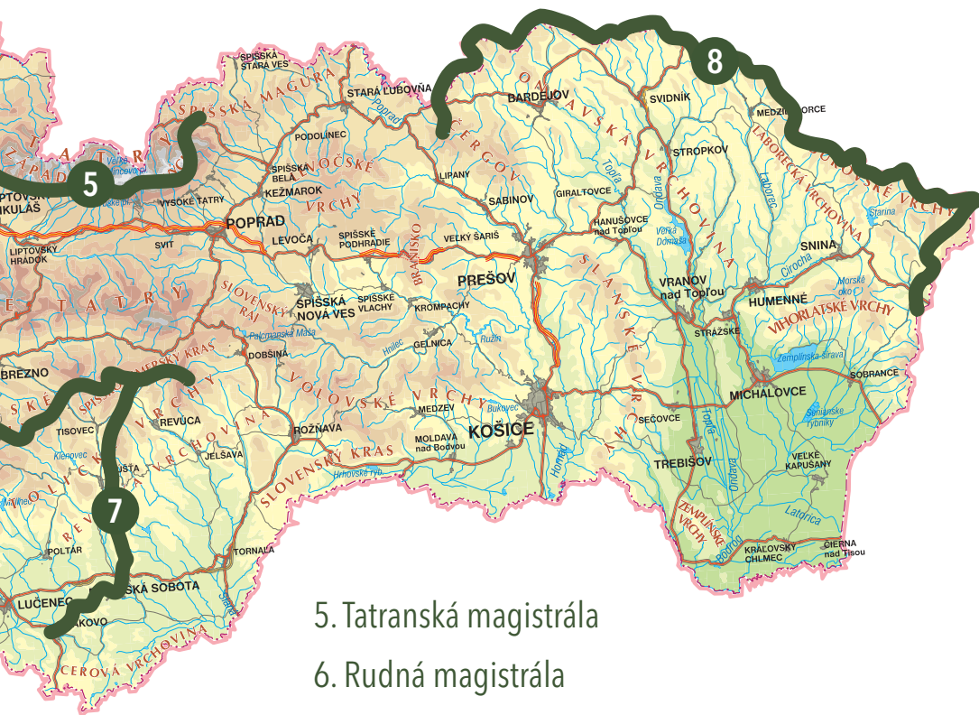
5. Tatranská magistrála

Okrem základného opisu každého dňa trasy v knihe nechýbajú ani zaujímavosti súvisiace s jednotlivými miestami, cez ktoré magistrály vedú. Texty sú doplnené viac ako 150 farebnými fotografiami ilustrujúcimi priebeh trás. Veríme, že aspoň čiastočne vizuálne pripravia čitateľa na pohľady, ktoré ho na trase čakajú. Tie len doplnia celkové zážitky z absolvovania najkrajších diaľkových pochodov na Slovensku a celkom iste aj skvelé pocity po ich ukončení.