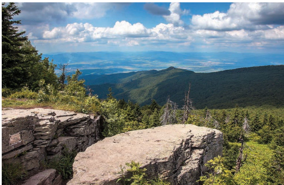
Výhľad z Vtáčnika na Ponitrianskej magistrále

Cesta hrdinov SNP je najpopulárnejšou turistickou magistrálou na Slovensku a z tohto dôvodu sme jej venovali samostatnú publikáciu, ktorá je súčasťou našej trilógie Turistické Slovensko. Vo svojej podstate zahŕňa aj Štefánikovu magistrálu vedúcu z Devína po Štefánikovu mohylu na Bradle a Cesta hrdinov SNP potom pokračuje už samostatne z Bradla až do Duklianskeho priesmyku. Keďže na Slovensku sa uvádza desať peších turistických magistrál (Cesta hrdinov SNP a Štefánikova magistrála patria tiež do tohto počtu), my sme do našej knihy Turistické magistrály zaradili osem dialkových trás. V tejto súvislosti treba poznamenať, že na Slovensku neexistuje presná terminológia toho, „čo je to magistrála“. Tento termín sa používa len voľne pre dialkové viacdenné