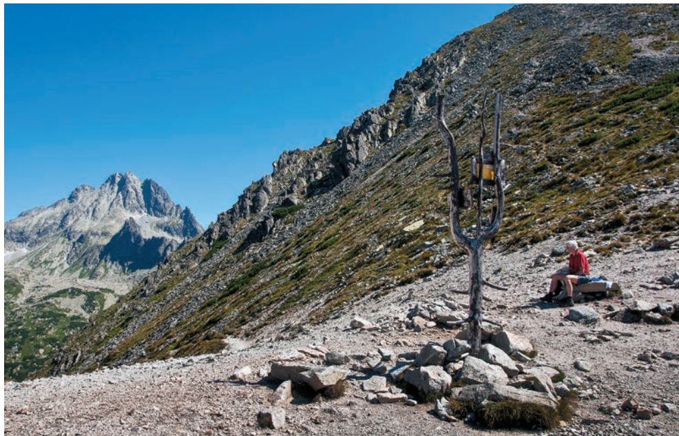
Sedlo Ostrva na trase Tatranskej magistrály

pešie turistické trasy značené v teréne červenou farbou. My sa takisto držíme tohto nepísaného „úzu“, a tak v knihe dostalo priestor osem magistrál spĺňajúcich kritérium „viacdennosti“ a červeného značenia.