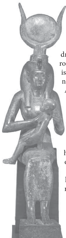
Obr. 3: Sediaca bohýňa Eset dojčiaca syna Hora. Egypt, neskoré obdobie. Socha Eset, kŕmiacej syna Hora, je považovaná za predobraz kresťanskej dojčiacej madony.

Aj na historických územiach, ktoré tvoria dnešný Izrael, boli hlinené modly z biblického predkresťanského obdobia zväčša ženského pohlavia, často s dôrazne nadvihnutým poprsím. Jasne to vidieť na stĺpových sochách fenickej bohyně lásky a plodnosti Aštarty z obdobia od 8. do 6. storočia pred n. l. Táto dea nutrix , teda bohýňa živiteľka, sa opisovala ako „strom s ňadrami“ a „stelesnenie modlitby za plodnosť a požíveň“. 5