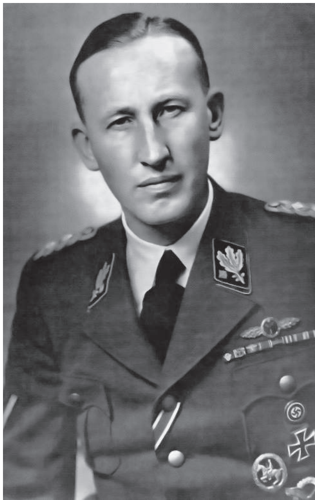
Portrétní snímek osmatřicetiletého Heydricha, 1942.