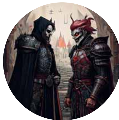
Éra umelej inteligencie 42