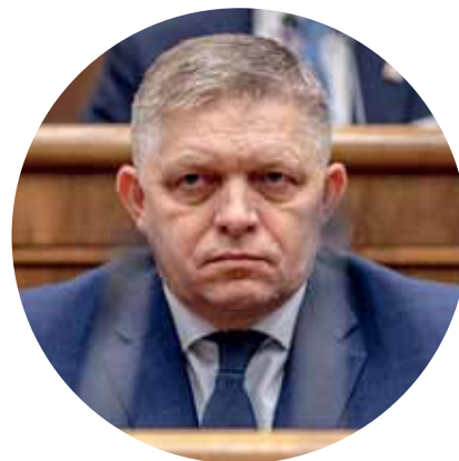
Fico v područí démonov 22