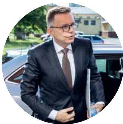
Amnestia našich ľudí 36