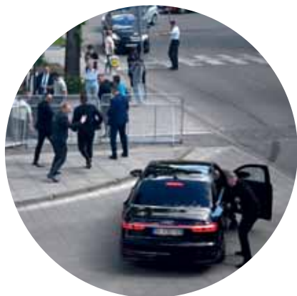
Atentát na premiéra 6