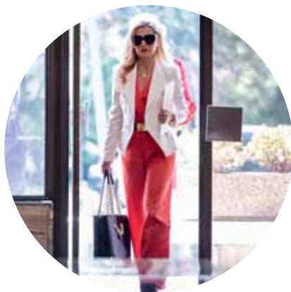
Kobercový nálet na kultúru 14