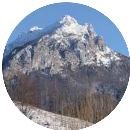
Prírodné bohatstvo v ohrození 68