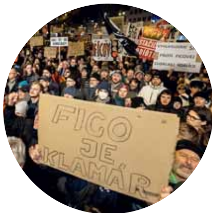
Povolebné vytriezvenie 80