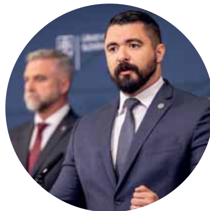
Statky klanu Gašparovcov 94