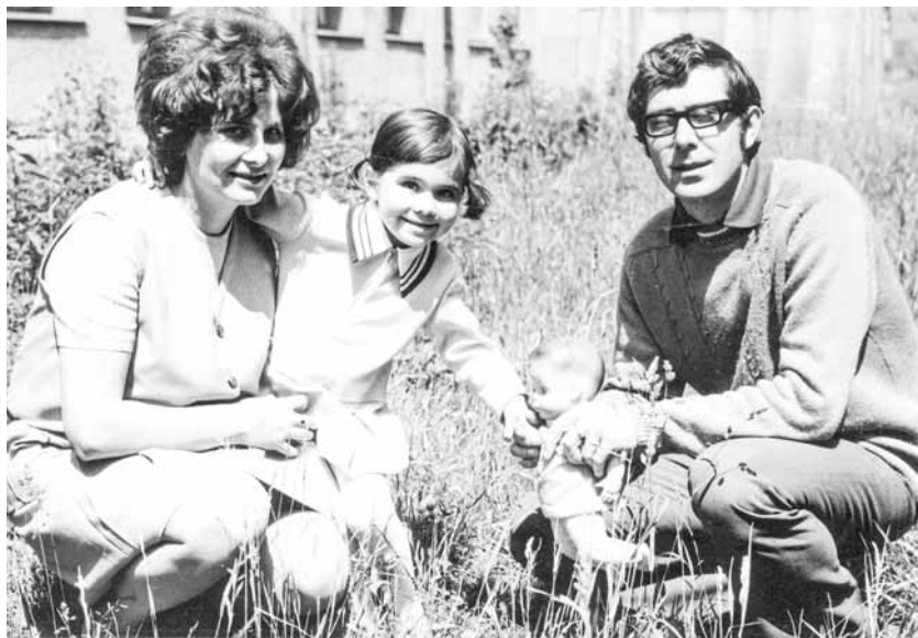
S rodičmi.

V živote som stretla veľa vzácných ľudí. V prvom rade tých, ktorým ďakujem za to, že som tu. Mojich rodičov a starých rodičov. Všetci boli, rodičia aj dodnes sú, pre mňa obrovskou inšpiráciou ako žiť a byť vnímavým, citlivým a ohľaduplným človekom. V tom mojom rozhlasovom živote som stretla tiež veľa múdrych a láskavých ľudí, ktorí ma obohatili a vďaka nim som, verím, odovzdala ich posolstvá aj poslucháčom.