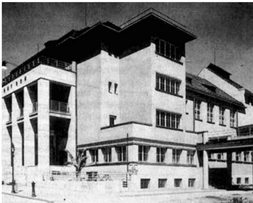
Banskobystrický Národný dom na dobovej fotografii.