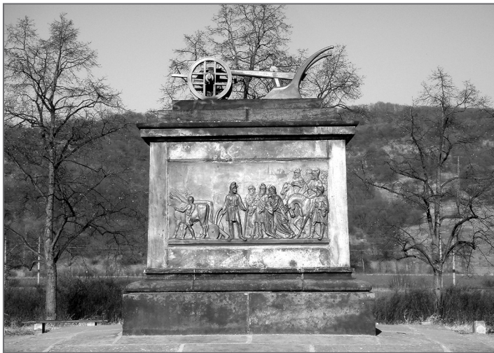
Pomník Přemysla Oráče na Královském poli ve Stadicích

Zajímavá je v tomto příběhu role železa, a to v podobě Přemyslovy železné radlice. Kosmas toto téma do svého vyprávění vůbec nezahrnul. Tzv. Dalimil vypráví, jak Přemysl vyňal z lýkové mošny ke snídani chléb a sýr (toto