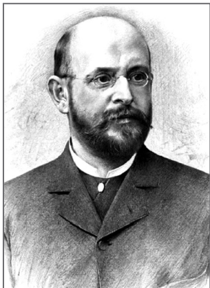
Portrét Aloise Jiráska od Jana Vilímka

Dále se Jirásek pokusil vypořádat s oním prahem, podobně jako tzv. Dalimil, tak, že hlava se sklání proti němu. Samozřejmě ale jen v tom případě, když je vchod do domu nižší než výška postavy vcházejícího. Snad je to třeba chápat tak, že onen muž hodlá postavit jen malý domek s nízkými vchodovými dveřmi. Druhou část proroctví Jirásek zcela vynechal. Kdybychom neměli Kosmovo podání, tedy kdyby se nedochovalo, ani bychom nevěděli, že nějaká druhá