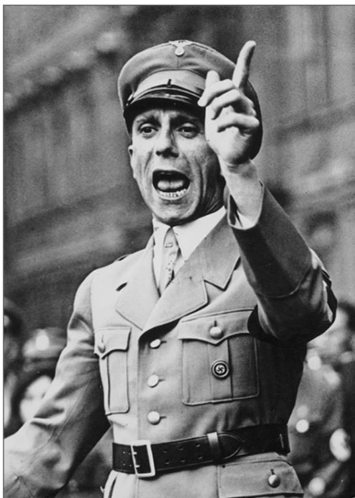
Joseph Goebbels, hlavní propagandista Hitlera a národních socialistů, horlivě promlouvá na shromáždění v roce 1934.