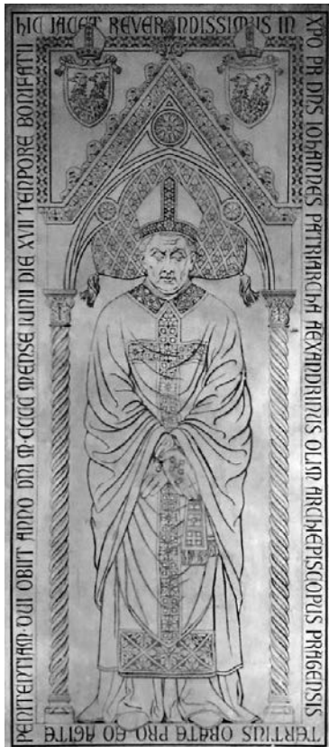
Náhrobek arcibiskupa Jana z Jenštejna v bazilice sv. Praxedy v Římě