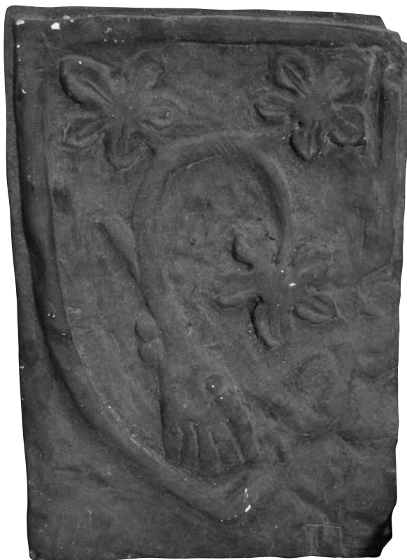
Rodový znak biskupa Jana IV. z Dražic na dlaždici z klášterního kostela v Roudnici nad Labem, který založil

Jistě ne náhodou se i v českých zemích vnitřní christianizace začala častěji vynořovat v klášterní samotě dvou tří řádů než v rušném prostředí světského duchovenstva. Statuta roudnických kanovníků sv. Augustina, která posloužila jako vzor všem pozdějším kanoniím tohoto řádu v zemích České koruny a zčásti i jinde, nebyla svými individualistickými novotami a důrazem na sebevzdělání takovým průlomem do přežilých zvyklostí, jak se dříve soudilo. Totéž zřejmě platí i pro jinak pozoruhodnou klauzuli zakladatele Jana IV. z Dražic, podle níž byl roudnický konvent vyhrazen pouze příslušníkům českého „jazyka“ po otci i matce. Jazykově národnostní uzavřenost roudnické kanonie, pokud se vůbec uskutečnila, trvala nanejvýš pouhých patnáct let, neboť roku 1349 papež Klement VI. na žádost Karla IV. původní předpis zrušil. Obliba, které se augustiniánští kanovníci těšili u Karla IV. i arcibiskupa Arnošta z Pardubic, vylučuje možnost, že by jejich náboženský nonkonformismus přesahoval do polohy proticírkevní kritiky. Pokud by však právě v roudnické kanonii vznikly dílčí staročeské překlady biblických knih nebo latinsko-české slovníky, bylo by to postačující satisfakcí zakořeněné představy o kulturním působení tohoto řádu v našich zemích. 6