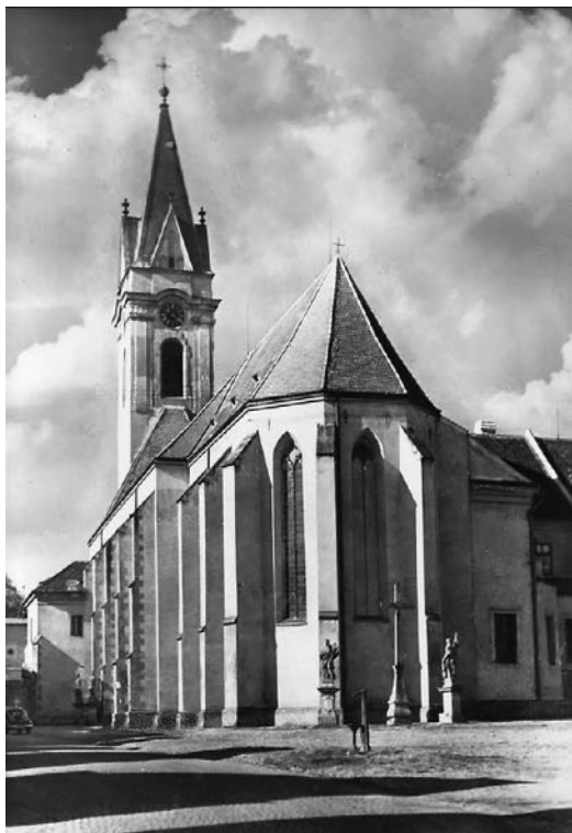
Kostel Panny Marie a sv. Jiljí při klášteře kanovníků sv. Augustina v Třeboni