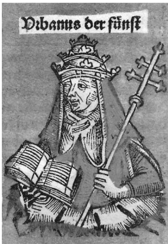
Imaginární portrét papeže Urbana V. ve Světové kronice Hartmanna Schedela

I když události dvou uplynulých kritických let 1365–1367 jeho chmurné vize o Antikristově příchodu nepotvrzovaly, trpká zkušenost z římského pobytu Milíče jen utvrdila v představě, že se církev ocitla ve spárech biblických oblud Behemoth a Leviathana. A protože se mu slyšení u papeže nedostalo, rozhodl se sdělit své utajené úvahy písemně. V listu k Urbanovi V. tento nemytý a vyzáblý asketa, jenž podle nakloněného mu cizince v ničem neznal pravou míru, 36 odhodil svíravou kazajku pražského mravokárce a představil se jako tribun nápravy celého křesťanského světa. Není ani divu, že své názory nechtěl nikomu jinému sdělit. „Ejhle nejprve,“ obrací se po krátkém úvodu na papeže, „knížata tvoji jsou druhové zlodějů, všichni milují úplatky, jdou za odměnami, sirotkům neposkytují spravedlnosti a nevstupuje k nim pře vdovy, totiž církve svaté.“