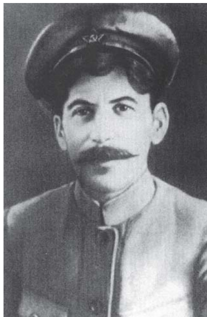
Stalin za občanské vátky 1918

aby byl pro své charakterové vady z tak vysoké funkce odvolán, jeho přání však nebylo vyslyšeno). Volkogonov na jiném místě 8 píše, že Stalinův prostý styl v sobě skrýval „hluboký primitivismus a intelektuální ubohost“. Tak se stalo, že byl Stalin od samého začátku v nejvyšším vedení strany a tím i státu, od léta roku 1919 byl členem politického byra. Tvořili ho v té době Lenin, Kameněv, Krestinskij, Stalin a Trockij, a i když docházelo pod Leninovou taktovkou k jeho postupné obměně, Stalin v něm nikdy nechyběl. Většinou jako jediný z vedení zasedal ještě v tzv. organizačním byru, kde měl na starosti realizaci, provedení a kontrolu přijatých závěrů. Proto Stalina málokdo znal, většina neměla o jeho činnosti ani ponětí a světový tisk ještě v roce 1924 komolil jeho jméno.