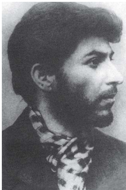
Stalin – policejní foto z roku 1902

zemřela na tyfus a Jakov zůstal u rodiny jeho zemřelé manželky, kde se se o něho starala její sestra. Stalin se s ním stýkal opravdu zřídka.