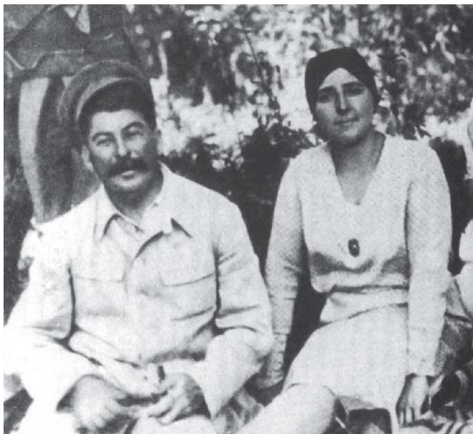
Stalin s druhou manželkou Naděždou Allilujevovou

v roce 1917 bylo 16 let, našel Stalin cestu, v roce 1919 si ji vzal za manželku a v březnu 1921 se jim narodil syn Vasilij).