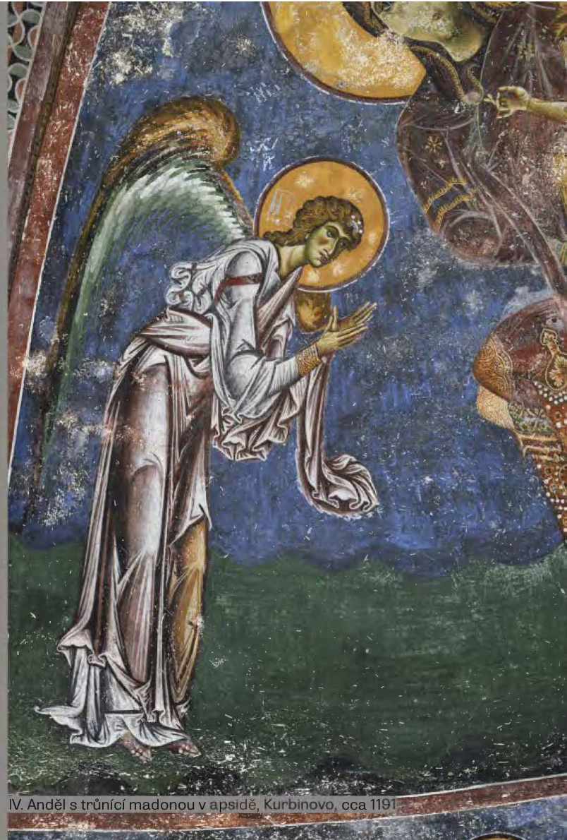
IV. Anděl s trůnící madonou v apsidě, Kurbinovo, cca 1191