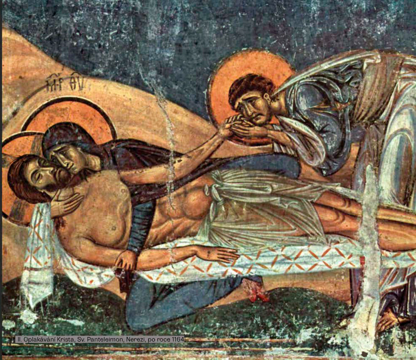
II. Oplakávání Krista, Sv. Panteleimon, Nerezi, po roce 1164