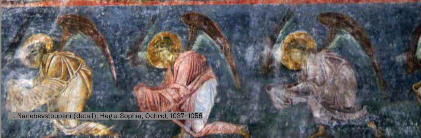
I. Nanebevstoupení (detail), Hagia Sophia, Ochrid, 1037–1056