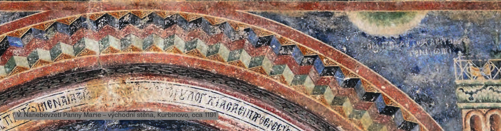
V. Nanebevzetí Panny Marie – východní stěna, Kurbinovo, cca 1191