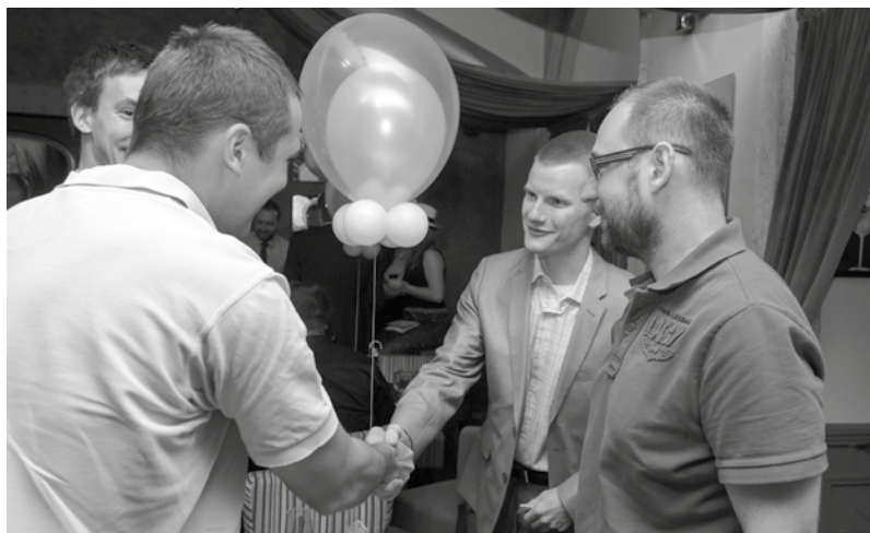
Obr. 4 Aktivní networker, který seznamuje své kontakty ( Business & Pleasure Networking, 2014 ).

Aktivní networker je člověk, který disponuje širokým sociálním kapitálem, tedy spoustou kontaktů. Jsou to převážně organizátoři akcí, majitelé různých společenských klubů, novináři, lobbisté, politici a další. Tito lidé vás dokáží propojit téměř s kýmkoliv. A dost často vám během řeči sami navrhnou, s kým by vás mohli propojit. Kontakty nejen mají, ale jsou také ochotni je použít pro ostatní.